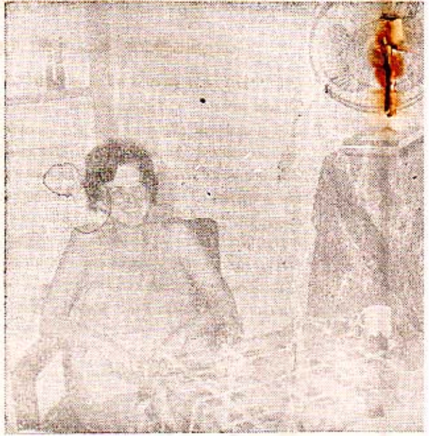
மக்கள் விடுதலைப் படையால் (P.L.A) சி. ஐ. ஏ. உளவாளிகளான அல

உலக சோசலிச முகாமை அழித் தொழித்துவிடவும், சோசலிச திசைவழியைக்