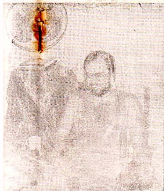
டயால் (P.L.A.) கடத்தப்பட்ட பிள்ளை அலன் தம்பதிகள்

சுழ மக்களுக்கு குடி நீர் வழங்க தனது திபுணர் களை அனுப்பி வைக்கிறதாம். வயட்னாம மக்களுக்கு எதிரான கொலைபாதகப் போரில் விசகருணைகளை வீசிய அமெரிக்கா, தற் போது விடுதலைக்காக போராடும் மத்திய அமெரிக்க மக்கள் மீது தனது இராணுவ மேலாண்மையை செலுத்தியதும் அமெரிக்கா, விடுதலை வேண்டி போராடும் எல்சலவ டேட்டர்களில் இதுவரை 40 ஆயிரம்பேரை தண்டவல் நாங்கள் மூலம் வேட்டையாடி மற்றொரு சகாதிபத்திப அமெரிக்க ஆயிரம் டிராங்ங்ங் போராடும் சுழ மக்க ளு துதாகம் கணிக்க குடி நீர் வழங்க ஆலோச கர்களை அனுப்பி உதவுகிறதாம். இந்த ஆலோசகர்க்கா மிகவும் நல்லவர்களாம். அப்பாவிக்களாம்.