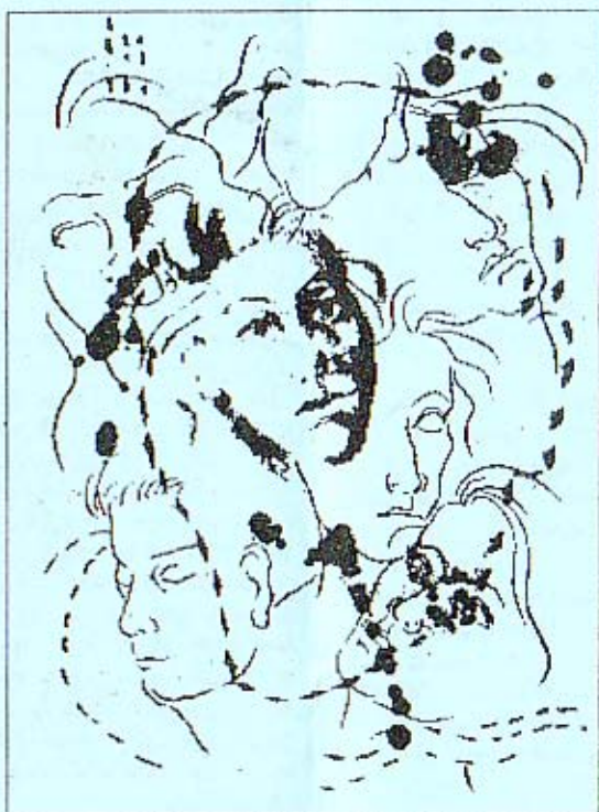
செல்வி வைத்தியரின் கைவண்ணம்