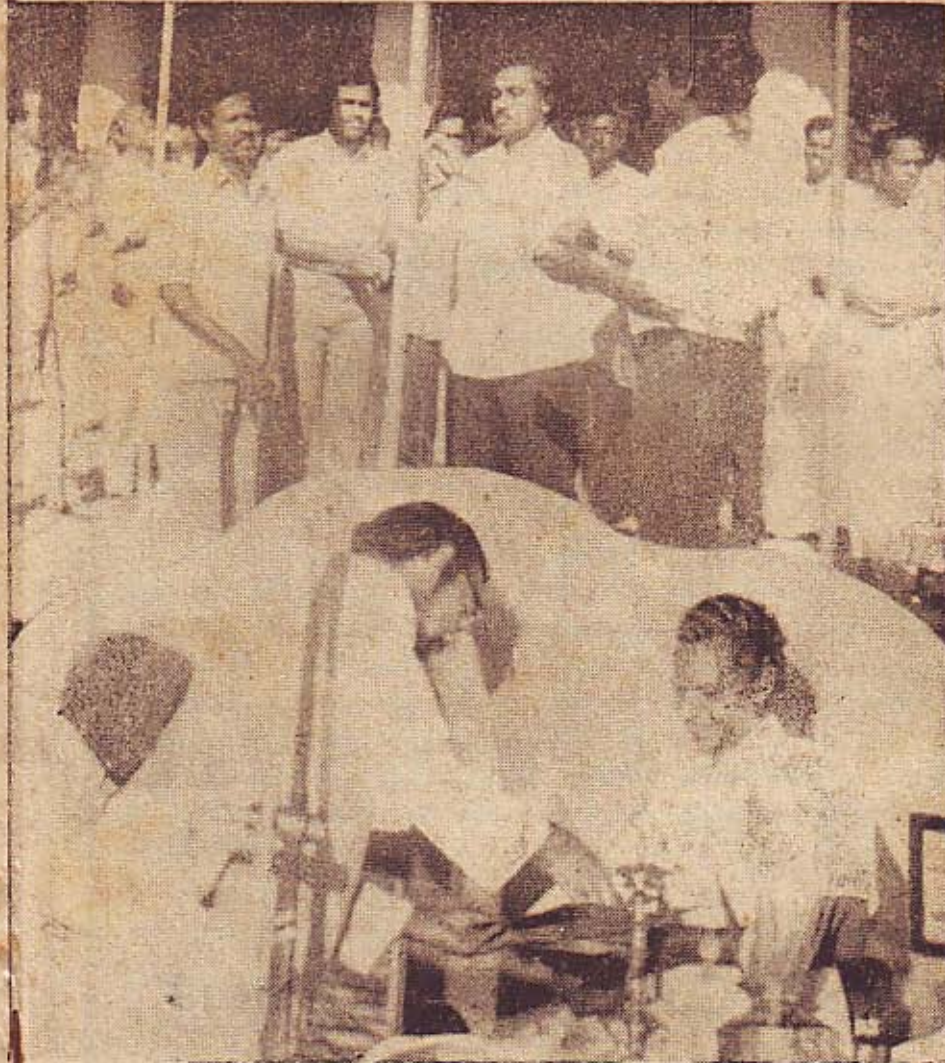
வெளியீட்டு விழாவின்மீது ... ..