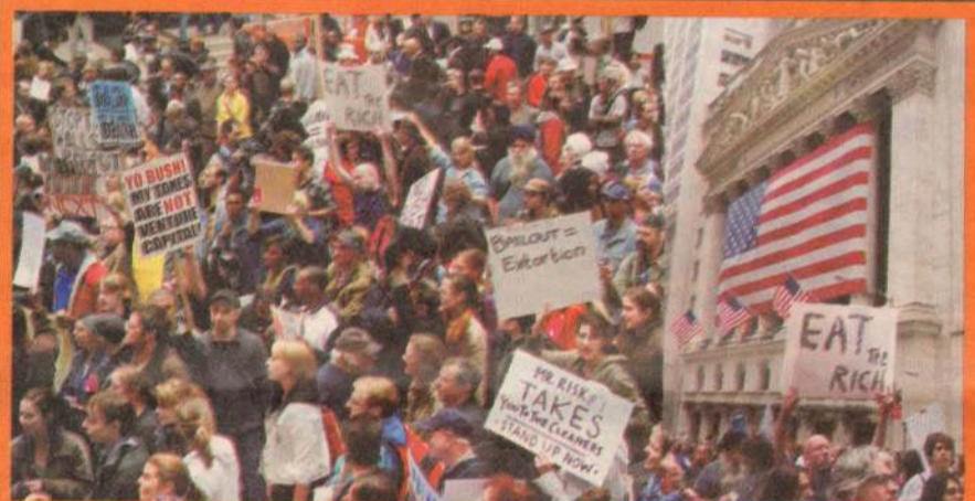
நியூயோக்கில் வோல் ஸ்ட்ரீட் எதிர்ப்பு ஆர்ப்பாட்டத்தில் பல்லாயிரக்கணக்கான அமெரிக்க மக்கள் தொடர்ந்து விதிப் போராட்டம் நடத்தி வருகின்றனர்.