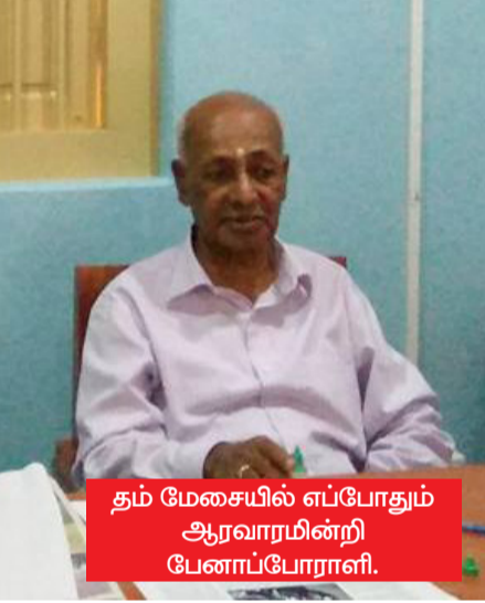
தம் மேசையில் எப்போதும் ஆரவாரமின்றி பேனாப்போராளி.

தனது ஊடகப் பயணத்தினை வீரகேசரி ஆசிரியர் பீடத்தில் ஆரம்பித்து, தினபதி பத்திரிகையின் ஆசிரியராக கடமை யாற்றிய போது தினபதி பத்திரிகை இடை