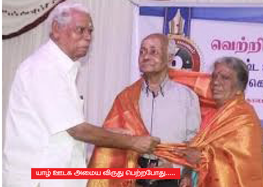
யாழ் ஊடக அமைய விருது பெற்றபோது....

'நாம் கடந்து வந்த பாதையில் சுமந்த வலிகளின் ஊடாகப் புரிந்துகொள்ள முடியும். ஊடகமாக மக்களுக்கான தகவல்களைச் சரிவர வழங்கி, எம் மக்களின் உரிமைகளுக்காகப் பேசுகின்றோம். அதனில்