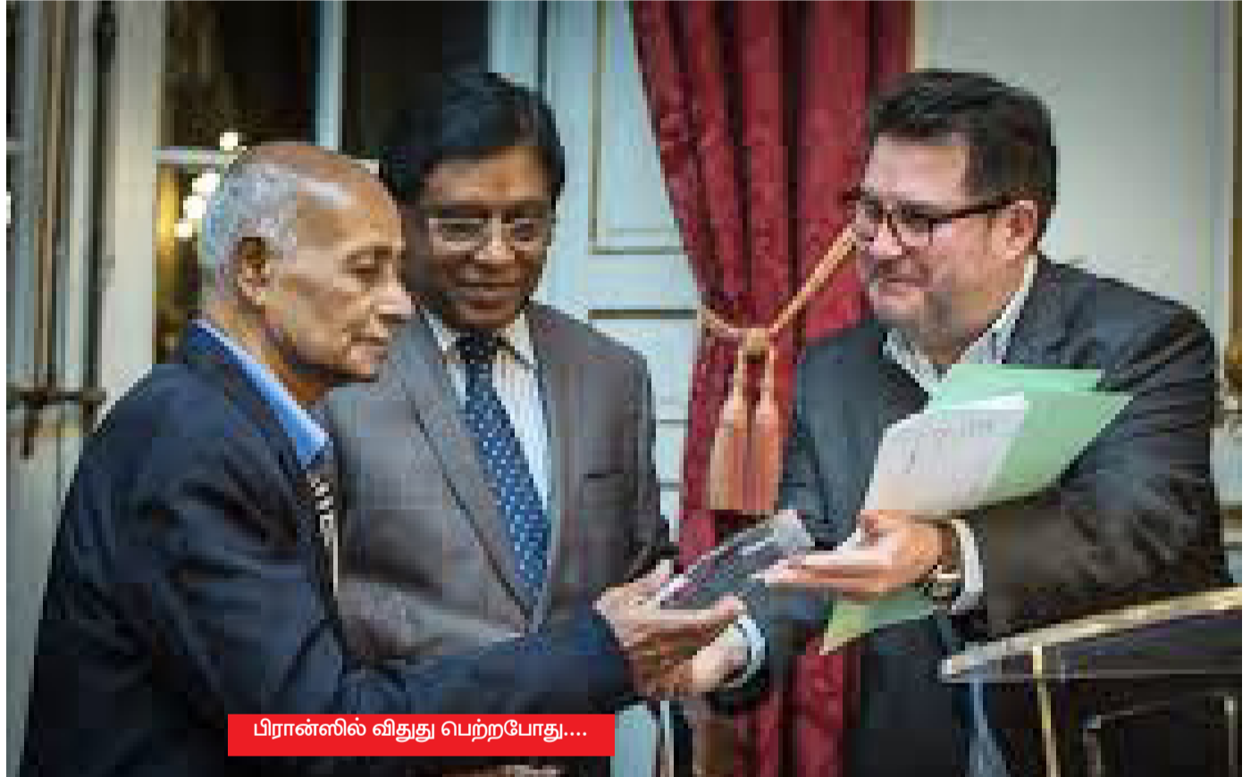
பிரான்ஸில் விதுது பெற்றபோது....

ஆயினும் வடக்கில் இருந்து வெளியான தமிழ் மக்களின் குரலை கொடுங்கோலர்களால் நசுக்க முடியவில்லை.