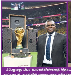
22ஆவது டீபா உலகக்கிண்ணத் தொடர் நேற்று முன்தினம் கட்டாரில் கணகர்க்கலை நிகழ்ச்சிகளுக்கு ஆரம்பமானது. ஆரம்ப நிகழ்ச்சிகள் இலாபிய பரம்பரிய முறைப்படி அல்-பைத் அராமில் ஏராளமான ரசிகர்கள் முன்னிலையில் ஆரம்பமானது.