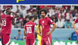
முடிந்தது. ஆட்டத்தில் இரண்டாம் பாதியில் இரு வரலாற்றில் முதல் முறையாக தொடரை நடத்தும் கட்டார் அணி முதல் போட்டியில் நேற்று கோலான மோசமான சாதனையை பதிவு செய்தது.

22ஆவது டீபா உலகக்கிண்ணத் தொடர் நேற்று முன்தினம் கட்டாரில் மிக மிகமிகமான ஆரம்பமானது. ஆரம்ப போட்டியில் குறா ஓய் இடம்பெற்றுள்ள தொடரை நடத்தும் கட்டார் - ஈவெட்சே அணிகள் பலப்படுத்தி நடைபெற்ற போட்டியில் 16ஆவது நிமிடத்தில் கிண்டிட்டு மௌஸ்டு வாய்ப்பைப் பயன்படுத்தி ஈவெட்சே அணியின் தலைவர் வானெட்சியா முதல் கோல் அடித்தார். மீண்டும் ஆட்டத்தில் 31ஆவது நிமிடத்தில் 2ஆவது கோல் அடித்தார் வானெட்சியா. 2-0 என ஈவெட்சே முன்னிலை வகித்து திவையிற் முதல் பதி ஆட்டம்