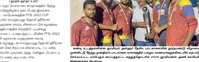
கனகா உடற்கலையின் ஜாடியில் அல்ஹர் தேயிஸ் பானாஸலயின் நூற்றாண்டு விழாவை முன்னிட்டு நேற்று முன்தினம் பாடசாலை வளாகத்தில் பழைய மனைவர்களுக்கிடையில் ஏற்பாடு செய்யப்பட்ட மாட்பெரும் கார்ப்பந்தாட்ட கற்றுத்தொடரில் 2005 ஜூரியல்ஸ் அணி மம்பிளின் கிண்ணத்தை வென்றது.

(நாடுகள் ஹீரோ உமர்) மருதுமுனை மசூர் மேன்மை சைதத்திற் நேற்று முன்தினம் குராய் நிறுவனம் நடைபெற்ற இலங்கை உதைப்பந்தாட்டம் ஈம்மேளத்தின் FFSL GOLD CUP சுற்றுப்போட்டியில் வெற்றிபெற்று ஹோலி ஹீரோஸ் வி.கழகம் மருதுமுனை வரலாற்றினைப் படைக்க உத்தேசம் எடுத்தது. மீண்டும் ஆட்டத்தில் 31ஆவது நிமிடத்தில் 2ஆவது கோல் அடித்தார் வானெட்சியா. 2-0 என ஈவெட்சே முன்னிலை வகித்து திவையிற் முதல் பதி ஆட்டம்