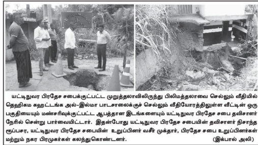
யடிகூலார் பிரதேச சபைக்குட்பட்ட முயத்தலாளிமருந்து பிலிமத்தாவை செல்வம் வீதியில் தெளிவாக ஊட்டடக்க அல்-இலம் பாடசாலைக்கு செல்லும் வீதிமேற்கத்தினை எட்டின் குடி பகுதியையும் மண்சரிவுக்குட்பட்ட இயத்தலாளி மருந்துவாய் யடிகூலார் பிரதேச சபை தலைவர் ரூபிச் செந்து பாடசாலைவிடம். இயத்தலாளி யடிகூலார் பிரதேச சபையின் தலைவர் திரைத் துல்லா, யடிகூலார் பிரதேச சபையின் உறுப்பினர் வரீசு குத்தர், பிரதேச சபை உறுப்பினர்கள் மற்றும் நகர பிரமுகர்கள் கலந்துகொண்டனர். (இடப்பால் அலி)