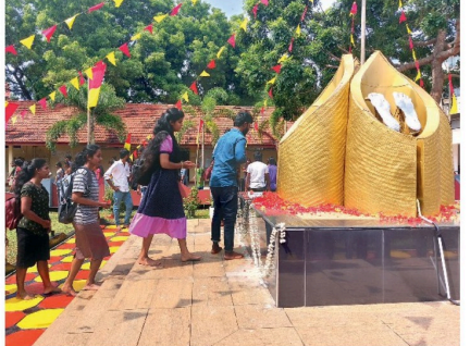
மாநில நினைவு வார்த்தை முன்னிட்டு யாழ்ப்பாணம் பல்லைக்கழகத்தில் மாணவர்களால் தூய்மை மாலை அணிவிக்கப்பட்டு, நேற்று மலர்ச்சி செய்தப்பட்டது.