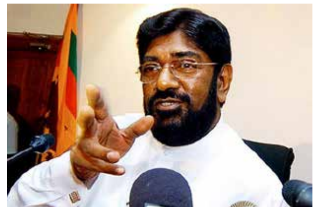
படும் எனவும் இதன்போது நீதிபதி குறிப்பிட்டார்.

மேலும் பிரதிவாதிகளின் கடவுச்சீட்டை நீதிமன்றத்தில் சமர்ப்பிக்குமாறு உத்தரவிட்டதுடன், வழக்கு விசாரணை நிறைவடையும் வரை வெளிநாட்டு பயணம் மேற்கொள்ள தடை விதித்தும் நீதிபதி உத்தரவிட்டார். முதல் பிரதிவாதி அரசு பயணமாக வெளிநாடு போக வேண்டி இருப்பின் அது தொடர்பாக மன்றைத் தெளிவுபடுத்துமாறும், அந்தச் சந்தர்ப்பத்தில் அந்த விடயங்களை ஆராய்ந்து அனுமதியளிப்பது தொடர்பாகப் பரிசீலிக்கப்