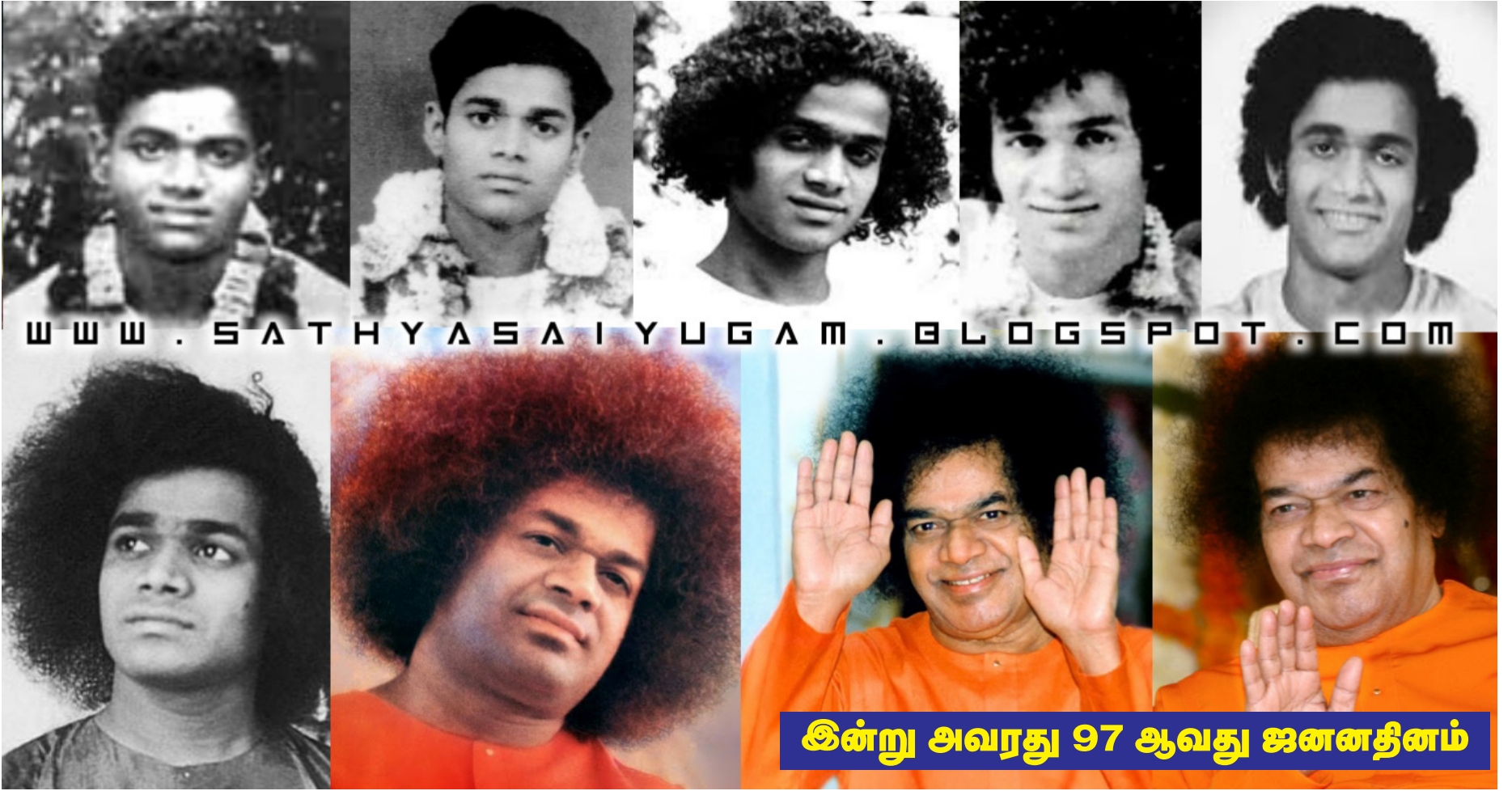
இன்று அவரது 97 ஆவது ஜனனதினம்

— எஸ் .என். உதயநாயகம் — (பகவான் ஸ்ரீ சத்ய சாயி பாபா மத்திய நிலையம் — கொழும்பு)