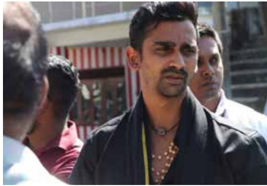
புளியாவத்தை நகரில் மாட்டிறைச்சி கடைக்

கான அனுமதியை நாடாளுமன்ற உறுப்பினர் ஜீவன் தொண்டமான் இரத்து செய்துள்ளார்.