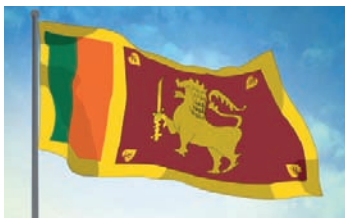
வழங்குவதற்கு அமைச்சரவை அங்கிகாரம் வழங்கியுள்ளது. தொடர்ச்சி P2

கட்டண அறவீடுகளின்றி தேசிய பூங்காக்கள், பொழுதுபோக்கு பூங்காக்கள், தாவரவியல் பூங்காக்கள் என்பவற்றை 75 ஆவது சுதந்திர தினத்தன்று பார்வையிடுவதற்கும் திரைப்படங்களை பார்ப்பதற்கும் பொதுமக்களுக்கு சந்தர்ப்பம்