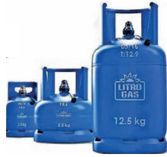
சிலிண்டர்கள் கைவசம் இல்லை என்று தெரியவந்துள்ளது. தொடர்ச்சி P2

நாடு முழுவதும் எரிவாயு சிலிண்டர்களுக்கு கட்டு தட்டுப்பாடு நிலவுவதாக நுகர்வோர் விசனம் தெரிவிக்கும் நிலையில், சிறு விற்பனையாளர்களுக்கு கடன் அடிப்படையில் சிலிண்டர்களை வழங்குமாறு லட்ரோ நிறுவனம் விநியோகஸ்தர்களுக்கு அறிவுறுத்தியுள்ளது. எரிவாயு விற்பனையாளர்களிடம் போதிய அளவான