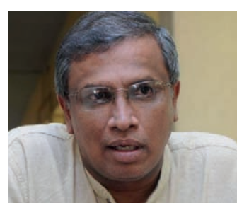
உரையாற்றும் போதே அவர் இதனை தெரிவித்துள்ளார். அதன்போது அவர் மேலும் தெரிவிக்கையில், தொடர்ச்சி P2

நீண்ட காலமாக நாட்டில் நிலவும் தமிழர் பிரச்சினைக்கு தீர்வு காண்பதாக ஜனாதிபதி தெரிவித்துள்ளமையை சந்தேக கண்ணாட்டிக்குடைய பாற்ப்பதாக தமிழ்த் தேசிய கூட்டமைப்பு பாராளுமன்ற உறுப்பினர் எம். ஏ.சுமந்திரன் தெரிவித்துள்ளார். பாராளுமன்றத்தில் நேற்று செவ்வாய்க்கிழமை வரவு செலவுத் திட்டத்தின் இரண்டாம் வாசிப்பு மீதான 7 ஆம் நாள் விவாதத்தில்