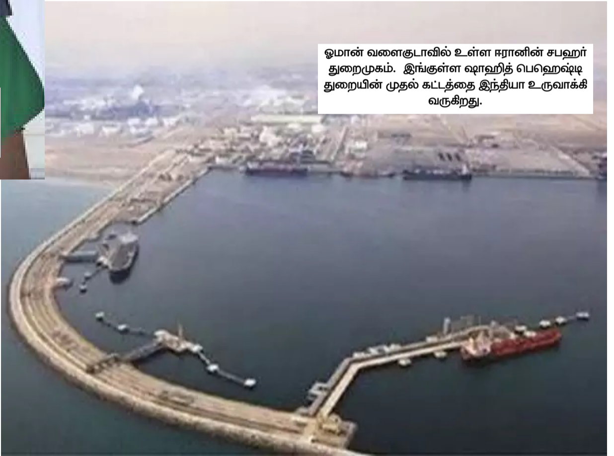
ஓமான் வளைகுடாவில் உள்ள ஈரானின் சபஹர் துறைமுகம். இங்குள்ள ஷாஹித் பெஹெஷ்டி துறையின் முதல் கட்டத்தை இந்தியா உருவாக்கி வருகிறது.

இந்தியா - ஈரான் வர்த்தக உறவுகள் பாரம்பரியமாக ஈரானிய மசகு எண்ணெயை இந்தியா இறக்குமதி செய்வதால் ஆதிக்கம் செலுத்தியது. 2018 - 19ஆம் ஆண்டில் ஈரானில் இருந்து 12.11 பில்லியன் டொலர் மதிப்பிலான மசகு எண்ணெயை இந்தியா இறக்குமதி செய்தது. இருப்பினும், மே 2, 2019 அன்று குறிப்பிடத்தக்க குறைப்பு விலக்கு (SRE) காலம் முடிவடைந்ததைத் தொடர்ந்து, ஈரானில் இருந்து மசகு எண்ணெய் இறக்குமதி செய்வதை இந்தியா நிறுத்தியுள்ளது. 2019 - 20