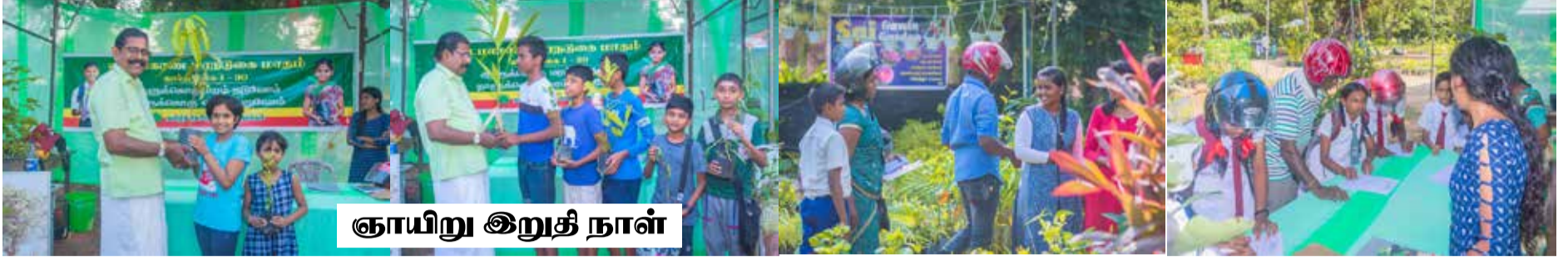
ஞாயிறு இறுதி நாள்

தமிழ்த்தேசியப் பசுமை இயக்கம் வடமாகாண மரநடுகை மாதத்தை முன்னிட்டு நல்லூர் சங்கிலியன் பூங்காவில் கார்த்திகை வாசம் என்ற மலர்க்கண்காட்சியை ஏற்பாடு செய்துள்ளது. மலர்ச்செடிகள் மற்றும் மரக்கன்றுகளைக் காட்சிப்படுத்தி விற்பனை செய்யும் 'மலர் முற்றம்' என்ற காட்சித் திடல் சங்கிலியன் பூங்காவில் கடந்த 18 ஆம் திகதி (வெள்ளிக்கிழமை) திறந்து வைக்கப்பட்டுள்ளது.