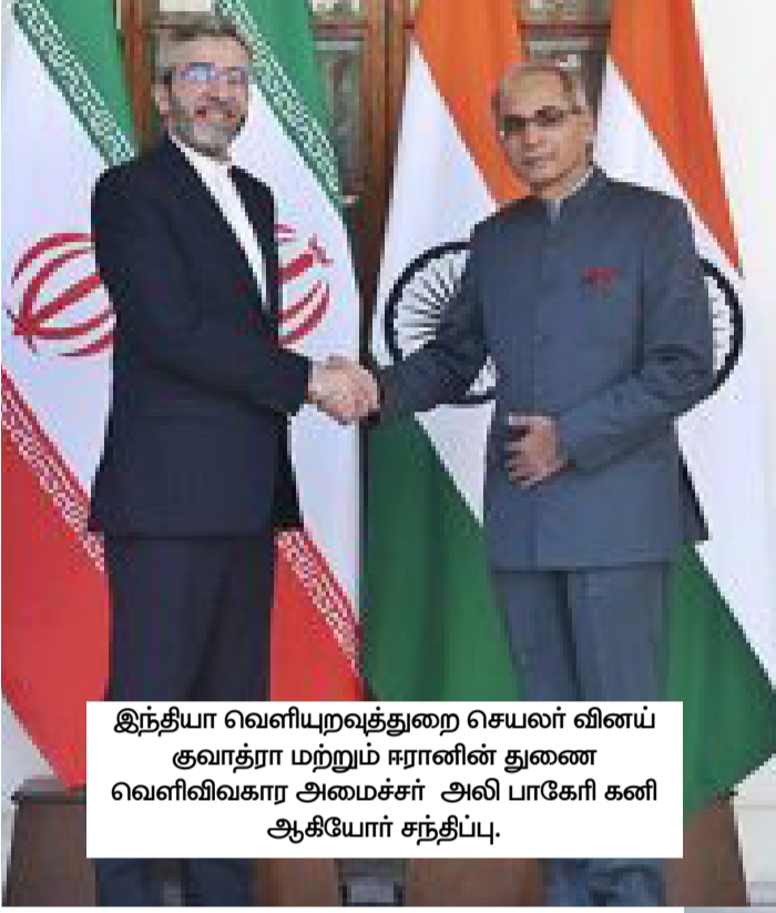
இந்தியா வெளியுறவுத்துறை செயலர் வினய் குவாத்ரா மற்றும் ஈரானின் துணை வெளிவிவகார அமைச்சர் அலி பாகேரி கனி ஆகியோர் சந்திப்பு.

புதுடெல்லிப் பேச்சுகளில் முன்னேற்றம் குறித்து ஆராய்வு