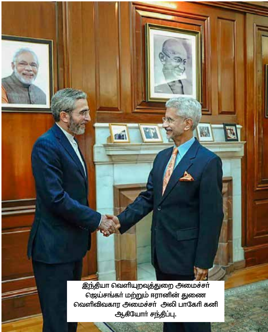
இந்தியா வெளியுறவுத்துறை அமைச்சர் ஜெய்சங்கர் மற்றும் ஈரானின் துணை வெளிவிவகார அமைச்சர் அலி பாகேரி கனி ஆகியோர் சந்திப்பு.

இந்தியா - ஈரான் உறவுகள் ஆயிரக்கணக்கான ஆண்டுகளாக அர்த்தமுள்ள தொடர்புகள்