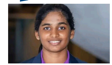
2021 ஆம் ஆண்டுக்கான ஜி.சீ.ஈ. சாதாரண தரப்