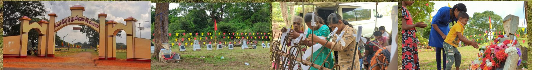
தமிழினத்தின் விடுதலைக்காகத் தங்களை ஆகுதியாக்கிய வீரமறவர்களை நினைவேந்தும் மாவீரர் நாள் நிகழ்வுகள்