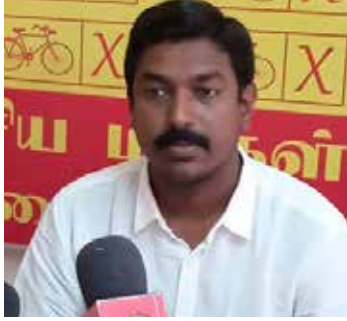
நடந்துகொள்ள வேண்டும் என்பது தான் எங்கள் நிலைப்

யாழ்ப்பாணம், நவ. 28 ஜனாதிபதி சர்வதேச ஆதரவைப் பெறுவதற்காகவும் பொருளாதார ரீதியாகச் சீர் குலைந்திருக்கின்ற நாட்டைக் காப்பாற்றுவதற்காகவும் தமிழ் மக்களின் பிரச்சனைகளுக்கு தீர்வைக் காண்பதுபோல ஒரு நாடகத்தை ஆடுவதற்கு முற்படுகின்றார். இந்த நேரத்தில் தமிழ்க் கட்சிகள் மிகவும் அவதானத்துடனும், சாதுரியத்துடனும், சாணக்கியத்துடனும்