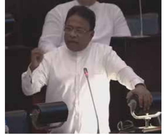
ணியில் மீண்டும் தேர்தல் முறைமை தொடர்பாக ஆராய தெரிவுக் குழுவை ஸ்தாபிப்பது அதிருப்தி தருகிறது.

மேலும் கலப்பு தேர்தல் முறைமைக்கு அனைவரும் இணக்கம் தெரிவித்துள்ள பின்ன