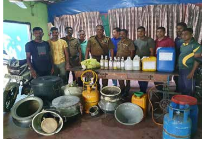
இரண்டு மோட்டார் சைக்கிளையும் பொலிஸார் கைப்பற்றியுள்ளனர். (அ)

மட்டக்களப்பு மாவட்டம் களுவாஞ்சிகுடி பொலிஸ் பிரிவுக்குட்பட்ட பல இடங்களில் கசிப்பு மற்றும் கோடா என்பன சட்டவிரோதமான முறையில் உற்பத்தி செய்யப்பட்டு விற்பனை செய்யப்படுவதாக களுவாஞ்சிகுடி பொலிஸ் விசேட புலனாய்வுப் பிரிவுக்குக் கிடைத்த இரகசியத் தகவலையடுத்து, துரிதமாக செயற்பட்ட பொலிஸார் பெருமளவு கசிப்பு மற்றும் கோடா போன்றவற்றை கைப்பற்றியுள்ளனர். அத்துடன், இந்தச் சம்பவங்கள் தொடர்பில் பெண் ஒருவர் உட்பட 6 பேரையும் சந்தேகத்தின் பெயரில் பொலிஸார் கைது செய்துள்ளனர். இதன்போது, கசிப்பு உற்பத்திற்கு பயன்படுத்தப்பட்ட பொருட்கள் மற்றும்