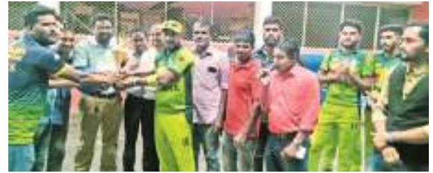
கல்முனை மத்திய தினகரன் நிருபர்

கல்முனை யங் பேட்ஸ் விளையாட்டுக் கழகத்தின் 30ஆவது ஆண்டு நிறைவை ஒட்டி நடத்தப்பட்ட சினே பூர்வ கிரிக்கெட் போட்டியில் கல்முனை ஜிம்கானா விளையாட்டுக் கழகம் வெற்றியீட்டியது. கல்முனை சந்தாங் கேணி ஐக்கிய மைதானத்தில் கடந்த சனிக்கிழமை (26) நடைபெற்ற இந்த போட்டியில் யங் பேட்ஸ் கழகத்தையே ஜிம்கானா அணி எதிர்த்தாயது. இதன்போது யங் பேட்ஸ் கழகத்தின் சீருமை அறிமுக நிகழ்வும் இடம்பெற்றது.