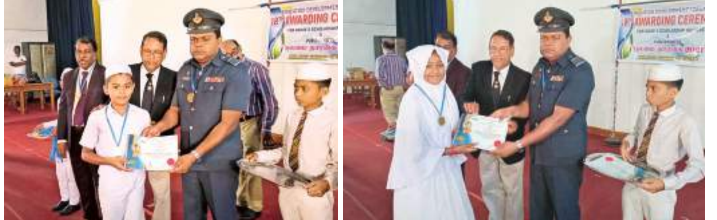
கல்வி அபிவிருத்தி ஒன்றியத்தினால் மட்டக்களப்பு, பொலன்னறுவை மாவட்டங்களில் புலமைப்பரிசில் பரீட்சையில் தமிழ் மொழி மூலம் 2021ம் ஆண்டு சித்தியடைந்த மாணவர்களை கௌரவித்து பாராட்டும் நிகழ்வு (27) குடியிருக்கிழமை ஹில்புலவாழ் மண்டபத்தில் நடைபெற்றது. இதில் மட்டக்களப்பு, மற்றும் பொலன்னறுவை மாவட்டங்களில் புலமைப்பரிசில் பரீட்சையில் தமிழ் மொழி மூலம் 2021ம் ஆண்டு சித்தியடைந்த 600க்கு மேற்பட்ட மாணவர்கள் பாராட்டி கௌரவிக்கப்பட்டனர்.கல்வி அபிவிருத்தி ஒன்றியத்தினால் 18வது வருடமாக நடாத்தப்பட்ட இந்த நிகழ்வில் புலமை தாரகை 2021 எனும் நூலும் வெளியீட்டு வைக்கப்பட்டது.

சித்தி பெற தவறி இருக்கின்றார்கள். மொத்தமாக 78 சதவீத மாணவர்கள் சித்தி பெற்றிருக்கின்றார்கள் என்றும் அவர் தெரிவித்தார். இம்முறை வெளியான பெறுபேறுகளின்படி வலயத்தில் முதல் அதிகூடிய 96% சித்தி மற்றும் அதிகூடிய 32 மாணவர்கள் 9 ஏ சித்திகளைப் பெற்ற பாடசாலையாக கல்முனை கார்மேல் பற்றிமா தேசிய கல்லூரி திகழ்கின்றது. அடுத்தபடியாக 17 மாணவிகள் 9ஏ சித்திகளுடன் கல்முனை மகுமூத் மகலிர் கல்லூரியும், அடுத்தபடியாக 9 மாணவர்கள் 9ஏ சித்திகளுடன் காரைதிவு இ.கி.சங்க பெண்கள் பாடசாலையும் முன்னணியில் உள்ளது.