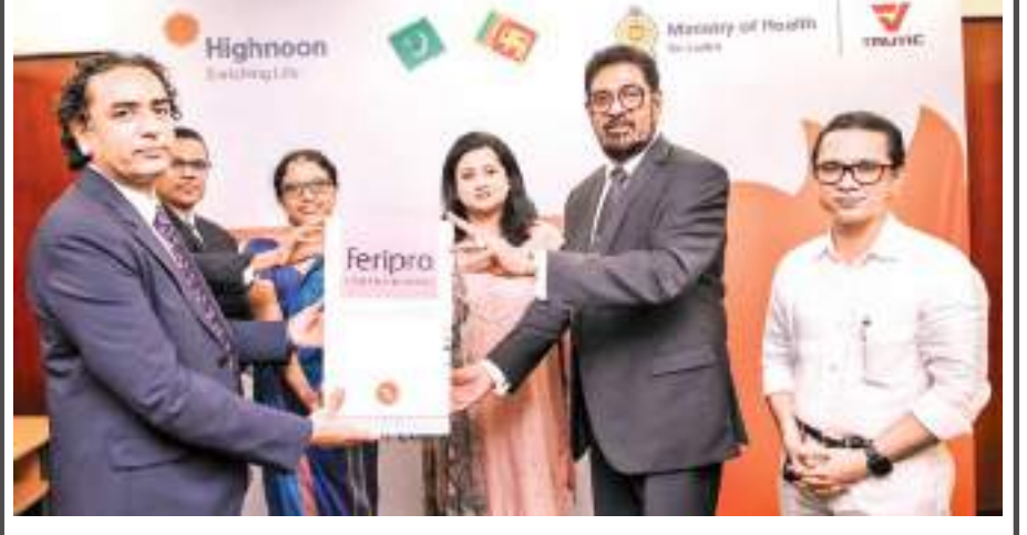
பாகிஸ்தானின் பிரபல மருந்து நிறுவனமான 'ஹைநூன்' ஆய்வு கூட்டத்தினால் தலசீமியா நோயால் பாதிக்கப்பட்டவர்களுக்கு வழங்கப்படும் வாழ்நாள்