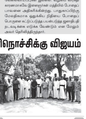
மாவீரர்களின் பெயர் பொறிக்கப்பட்ட கல்வெட்டுகள் மக்கள் அஞ்சலிக்காக நல்லூரில் அங்குராப்பணம்.