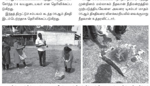
மாவீரர்களின் பெயர் பொறிக்கப்பட்ட கல்வெட்டுகள் மக்கள் அஞ்சலிக்காக நல்லூரில் அங்குராப்பணம். மாவீரர்களின் பெயர் பொறிக்கப்பட்ட கல்வெட்டுகள் மக்கள் அஞ்சலிக்காக நல்லூரில் அங்குராப்பணம்.

கள்ளகம் பஸ் நிலையத்துக்கு முன்னால் உள்ள தொலைபேசி கலையை உடைத்து அங்கிருந்து இயந்திரவியல் உபகரணங்கள் திருடிக்கொண்ட சம்பவம் தொடர்பில், கடந்த குரநிறுத்தியில் (20) சந்தேக நபர் ஒருவர் கைது செய்யப்பட்டுள்ளார். திருடிக்கொண்ட பொலீஸர் தெரிவித்தனர். கைது செய்யப்பட்டவர் பத்தூர் பகுதியைச் சேர்ந்த 24 வயதுடையவர் என தெரிவிக்கப்படுகிறது. இந்தத் திருட்டுச் சம்பவம் கடந்த 09ஆம் திகதி இடம்பெற்றதாக தெரிவிக்கப்படுகிறது.