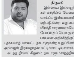
அங்குரா எம்.பி. சுட்டிக்காட்டு.

வரவு-வெலுத்தி உடனடியாகப் போட வேண்டும் என்று தெரிவித்தார். இது தொடர்பாக மேலும் அவர் கருத்து தெரிவிக்கையில், உத்தரவாசலில் உள்ள கிழக்கு மாவட்டத்தை மையப்படுத்தியே பாதுகாப்பற்ற இடத்தை அதிகரிக்கிறது. வடக்கு, கிழக்கு மாவட்டங்கள் அபிவிருத்தியில் தீவிரமாக உள்ளன. மேலும் பதிக்கப்பட்ட மக்களுக்கு முழுமையான நிவாரணம் கூட இல்லாதது குறிப்பிடத்தக்கது. முன்னர் போராட்டத்தில் ஈடுபட்ட மாவட்டங்கள், காவலாட்சிப்பெட்டவர்கள்,