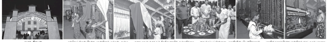
மாவீரர்களின் பெயர் பொறிக்கப்பட்ட கல்வெட்டுகள் மக்கள் அஞ்சலிக்காக நல்லூரில் அங்குராப்பணம். மாவீரர்களின் பெயர் பொறிக்கப்பட்ட கல்வெட்டுகள் மக்கள் அஞ்சலிக்காக நல்லூரில் அங்குராப்பணம்.