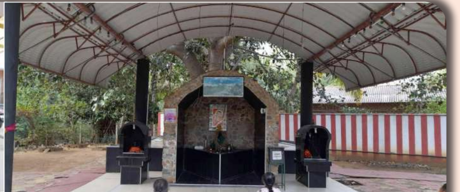
கதிர்காமம் பாபாஜி ஆச்சிரமம்