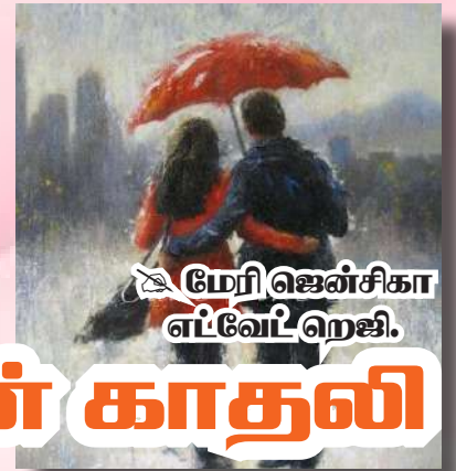
மேரி ஜென்சிகா எட்டுவெட்டுஜி.

உன் நினைவில் நான் கிருக்கையில், மேகங்களை கார்களுக்கி