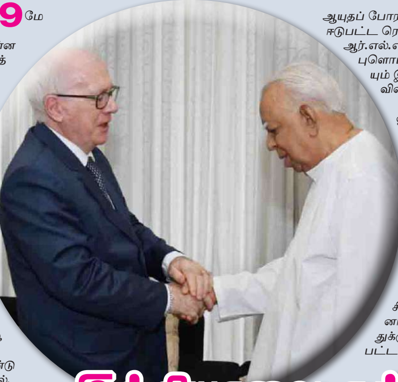
ஆயுதப் போராட்டத்தில் ஈடுபட்ட ரெலோ, ஈ.பி. ஆர்.எல்.எப் மற்றும் புளொட் ஆகியவையும் இதற்கு விதிவிலக்கல்ல. இலங்கை ஒற்றையாட்சி அரசியல் யாப்புக்குள் ஈழத்தமிழர்கள் தங்கள் அரசியல் அபி லாஷை களைப் பெற முடியும் என்ற எண்ணக்கரு சிங்கள ஆட்சியாளர்களினால் சர்வதேசத்துக்கு ஊட்டப்பட்ட ஒருநிலை

ஆயுதப் போராட்டத்திற்கு முன்னைய காலத்தில் அதாவது 70களில் இருந்து 83 வரையான காலத்தில் எந்த வகையான அரசியலில் ஈடுபட்டாராகனோ அதேபோன்ற அரசியல் நடைமுறைகளையே 2009 மே மாதத்திற்குப் பின்னரான சூழலிலும் தமிழரசுக் கட்சி கையாளுகின்றது.