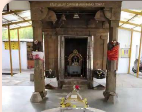
பரங்கிப்பேட்டை பாபாஜி கோயில்

உடலையும் உள்ளத்தையும் கட்டும் கயிறாக மூச்சு இருப்பதால் உடல், உள்ளம், ஆன்மாவை ஒரு நேர்கோட்டில் எடுக்கும் வித்தையே யோகக்கலை. இதற்குப்பல குருமார்கள் தோன்றினாலும் பதஞ்சலி, திருமூலர் போன்ற ஆதிருமார்கள் சிறந்த வழிகாட்டிகளாவர். இவர்தம்