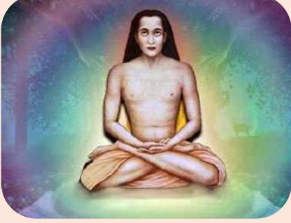
மகா அவதார் பாபாஜி

புல இல்லற யோகிகளுக்கு தனது கிரியா யோகம் மூலம் ஞானாசிரியராகவும் யோகாசிரியராகவும் திகழ்ந்து வருபவரும் 16 ஆவது வயதில் சொரூப சமாதியடைந்து, முதுமையையும் மரணத்தையும் வென்று, பல மெய்யடியவர்களுக்கு இன்றும் நேரே காட்சி கொடுக்கும் கிரியா மூலகுருவின் வாழ்க்கை வரலாற்றை பாபாஜியின் 'தெய்வீகக் குரலில்' இருந்து பார்ப்போம்.