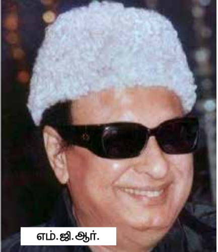
எம். ஜி. ஆர்.

அதுதான், ரணில் அரசியல்வாதி, பேரினவாதத்தையும் பேராண்மையையும் தனது மூதாதையர் டி. எஸ். சேனநாயக்க, டி. லி சேனநாயக்க, ஜே. ஆர். காலத்தில் இருந்து கட்டிக் காத்தவர், அவர் இந்திய ஒப்பந்தத்தை ஏற்கவில்லை, 13 ஆம் திருத்தச் சட்டத்தை ஆதரிக்கவும்