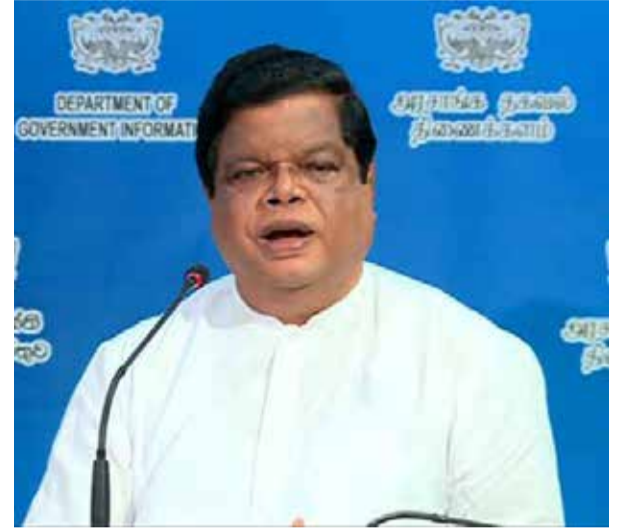
சுதந்திரத்துக்கு எதிராக செயற்படப் போவதில்லை. - என்றார்.

பல்வேறு காரணிகளால் நாட்டின் நற்பெயர் தொடர்பில் சர்வதேசத்தின் மத்தியில் தவறான சித்திரிப்புகள் காணப்படுகின்றன. ஒருசில ஊடகங்கள் ஊடகவியலின் அடிப்படை நெறிமுறைகள் மற்றும் ஊடக ஒழுக்கவியலுக்கு எதிராக செயற்படுகின்றமையை மறுக்க முடியாது. நாட்டின் முன்னேற்றத்தில் ஊடகங்கள் முக்கிய பங்கு வகிக்கின்றன. ஆகவே ஊடகங்கள் தாய் நாட்டுக்காக பொறுப்புடன் செயற்பட வேண்டும் என்பதை வலியுறுத்துகிறோம். சமூக ஊடகங்களைக் கண்காணிக்கும் வகையிலான சட்டத்தை இயற்ற அரசாங்கம் அவதானம் செலுத்தியுள்ளதாக குறிப்பிடப்படுகிறது. சமூக ஊடகங்கள் தற்போது ஊடக நெறியாக்கத்துக்கமைய செயற்படுகின்றனவா என்பது தொடர்பிலும் கவனம் செலுத்த வேண்டும். ஊடகங்கள் உயர் ஊடக கலாசாரத்தைப் பேணும் வகையில் செயற்படுவதற்கான நடவடிக்கை மேற்கொள்ளப்படும். ஊடகங்கள் மற்றும் ஊடக நிறுவனங்களின்