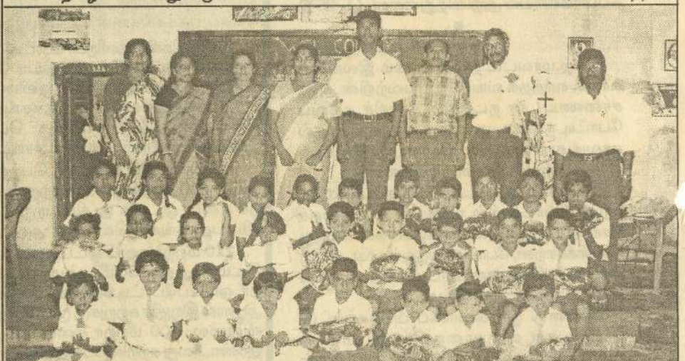
சரசாலை சரஸ்வதி வித்தியாலயத்தில் கற்கும் மாணவர்களில் தெரிவுசெய்யப்பட்டவர்களுக்கு கரித்தாஸ் - கியூடெக் நிறுவனம் சப்பாத்துகளை வழங்கியது. சப்பாத்துகள் பெற்றுக்கொண்ட மாணவர்களுடன் அதிபர், ஆசிரியர்கள் நிற்கின்றனர். (323)