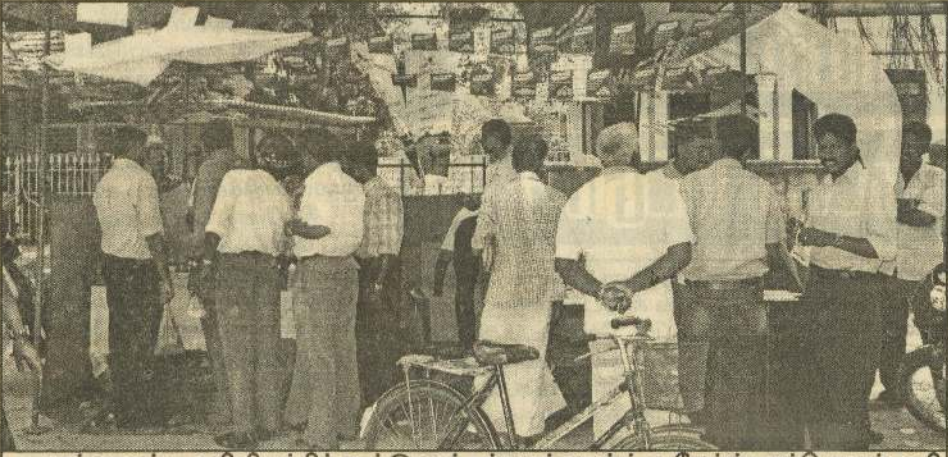
யாழ்.மாவட்ட அபிவிருத்திக் கூட்டுறவுச் சங்கமும் லான்ட் ஓ லேக்ஸ் பாற்பொருள் அபிவிருத்தி லங்கா நிறுவனமும் இணைந்து நடத்திய யாழ்.கோவின் பாற்பொருள் தயாரிப்புக்களின் மீள் அறிமுக நிகழ்வில் மக்கள் தமக்குத் தேவையான பாற்பொருள்களைக் கொள்வனவு செய்யும்போது எடுக்கப்பட்ட படம். (111)