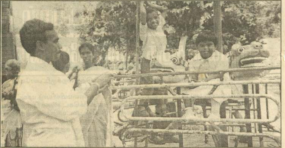
யாழ்.கல்வி வலயத்தின் விஷேட கல்விப் பிரிவினர் விஷேட தேவையுடைய மாணவர்களை பெற்றோர்களுடன் உள்ளக சுற்றுலா ஒன்றுக்கு அழைத்து சென்றனர். மாணவர்கள் பூங்கனிச்சோலையில் மகிழ்ச்சியுடன் விளையாடுகின்றனர்.