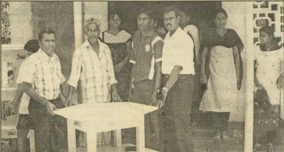
யாழ்.நகர்மைய நோட்டரக்ட் கழகம், சன்னாகம் நோட்டரக்ட் கழகம் என்பவை இணைந்து கந்தரோடை தூக்கா முன்பள்ளிக்குத் தளபாடங்கள் வழங்கியபோது எடுக்கப்பட்ட படம்.