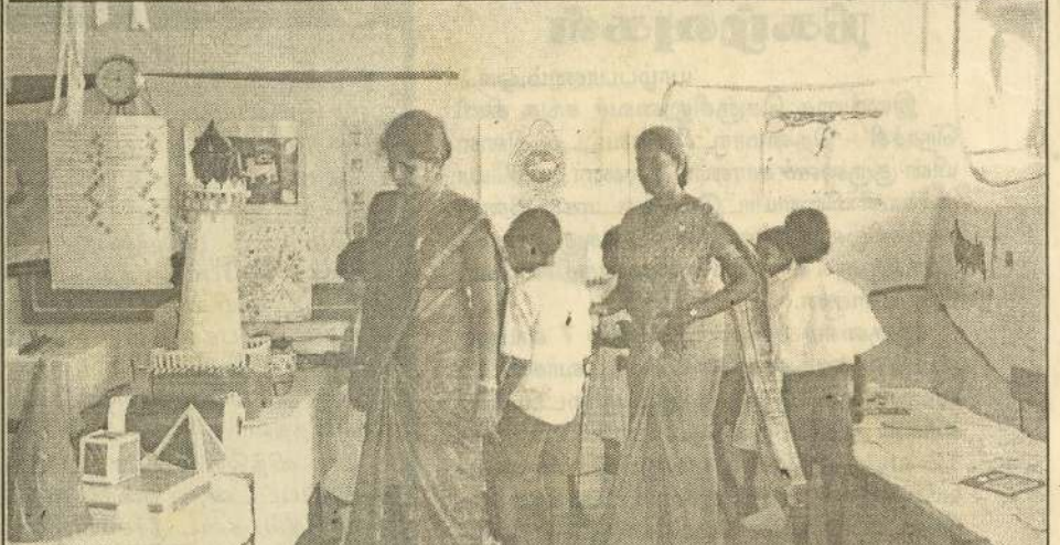
தொண்டைமானாறு கெருடாவில் இந்து தமிழ்க் கலவன் பாடசாலை நடத்திய கண் காட்சி நிகழ்வின்போது எடுக்கப்பட்ட படம்.