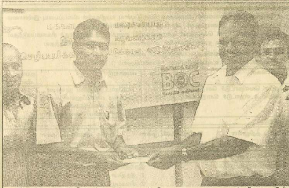
இலங்கை வங்கி உள்சாவற்றுறைக் கிளை முகாமையாளர், கிளையில் 18' சேரிப்புக்கணக்கினைப் பேணிய வடிக்கையாளர் ஒருவருக்கு, ஒரு பவுண் தங்கக் காசினை அவரது திருமணப் பரிசாக வழங்குகின்றார்.