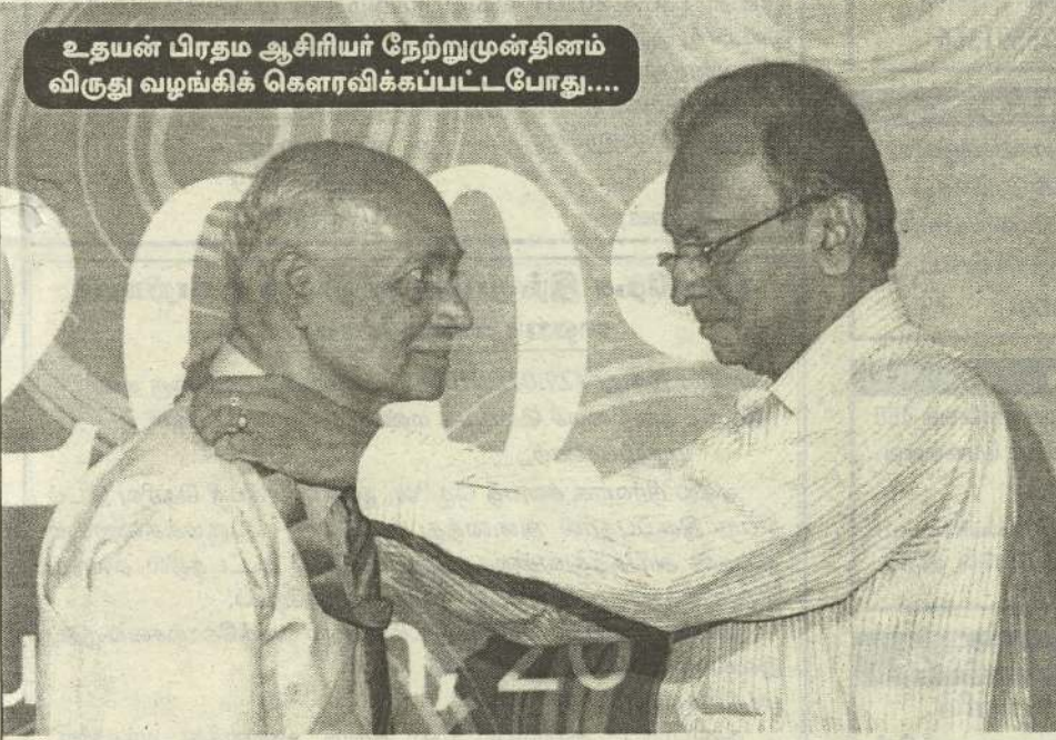
உதயன் பிரதம ஆசிரியர் நேற்றுமுன்தினம் விருது வழங்கிக் கௌரவிக்கப்பட்டபோது....