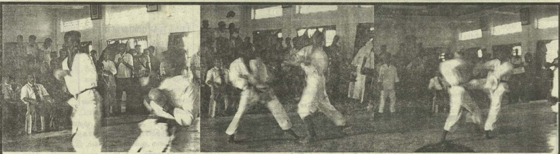
யாழ்ப்பாணம் கராத்தே சங்கம் பதிவு செய்யப்பட்ட கழகங்களுக்கு இடையே நடத்திய 2010 ஆம் ஆண்டுக்கான கராத்தே சுற்றுப்போட்டி கடந்த ஞாயிறாழிற்றுக்கிழமை யாழ்ப்பாணம் கல்வாரி தம்பர் மண்டபத்தில் இடம்பெற்ற கராத்தே சுற்றுப்போட்டியில் கலந்துகொண்ட வீரர்கள் மோதிக் கொள்ளும் காட்சிகளைப் படங்களில் காணலாம்.