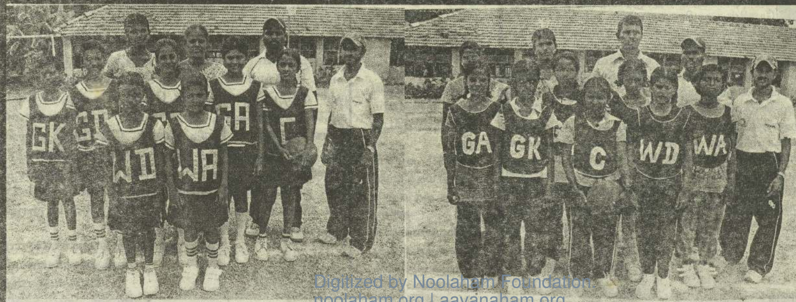
வலிகாமம் கல்வி வலயப் பாடசாலை அணிகளுக்கு இடையே நடைபெற்ற 12 வயதுப் பிரிவினருக்கான வலைப்பந்தாட்டத்தில் சம்பியனாகத் தெரிவு செய்யப்பட்ட சண்டிப்பாய் இந்துக் கல்லூரியையும், இரண்டாம் இடத்தைப் பெற்றுக்கொண்ட வட்டுக்கோட்டை யாழ்ப்பாணக் கல்லூரி அணியையும் படங்களில் காணலாம். (படங்கள்: நேசன்)

யாழ்ப்பாணம், நல்லூர் பிரதேச செயலக பிரிவுக்கு உட்பட்ட அணிகளுக்கான போட்டிகள் சனிக்கிழமை பிற்பகல் 4 மணியளவில் யாழ்ப்பாணம் கல்லூரி மைதானத்திலும்- வலிகாமம் பிரதேச செயலக பிரிவுகள் உட்பட்ட அணிகளுக்கான போட்டிகள் ஞாயிறாழிற்றுக்கிழமை பிற்பகல் 4 மணிக்கு இணுவில் சென்றல் கல்லூரி மைதானத்திலும்- இடம்பெறவுள்ளன என போட்டி ஏற்பாட்டாளர்கள் தெரிவித்துள்ளனர். (ஐ-23)