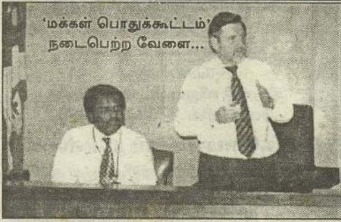
'மக்கள் பொதுக்கூட்டம்' நடைபெற்ற வேளை...