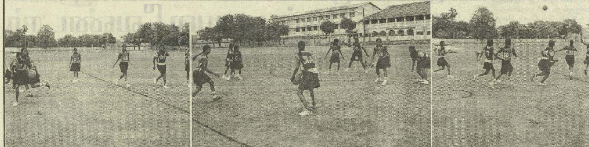
யாழ்.நகர் வைய நோட்டர் கழகம் நடத்திய உதைபந்தாட்டப் போட்டியில் யாழ்.பல்கலைக்கழக அணியும், சண்டிலிப்பாய் இந்து விளையாட்டுக் கழக அணியும் மோதிக் கொள்ளும் காட்சிகள் இவை.

யாழ்ப்பாணம், ஒக்.2 இலங்கைப் பல்கலைக்கழகங்களுக்கிடையிலான 10 ஆவது விளையாட்டு விழாவை முன்னிட்டு இலங்கைக் கரம் சம்மேளனத்தில் எதிர்வரும் 6ஆம், 7 ஆம் திகதிகளில் இடம்பெறவுள்ள போட்டிகளில் பங்குகொள்வதற்காக யாழ்.பல்கலைக்கழகத்தின் ஆண், பெண் கரம் அணியினர் நாளை ஞாயிற்றுக்கிழமை கொழும்பு புறப்படுகின்றனர். (த-23)