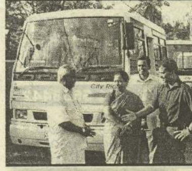
அரசினால் யாழ். மாநகர சபைக்கு அன்பளிப்பாக வழங்கப்பட்ட நான்கு பஸ்களின் போக்குவரத்துச் சேவை நேற்று வெள்ளிக்

கொழும்புத்துறை, ஒக்.2 இலங்கை இந்திய நட்புறவின் அடிப்படையில் இந்திய