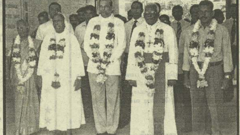
யாழ். திருக்குடும்ப கன்னியர்மடம் பாடசாலை தேசிய பாடசாலை யாகத் தரமுயர்த்தப்பட்டமை தொடர்பான நிகழ்வு நேற்றுமுன்தினம் இடம்பெற்றபோது எடுக்கப்பட்ட படம் இது.

யாழ்ப்பாணம், ஒக்.2 யாழ்ப்பாணத்தில் தற்போது பெய்துவரும் அடைமழையால் பல வீதிகளில் வெள்ள நீர் தேங்கியுள்ளது. இதனால் இவ்வீதிகளில் பயணம் செய்யும் பொதுமக்கள் பல சிரமங்களை எதிர்கொள்வதாகத் தெரிவிக்கப்படுகின்றது. இதனால் இந்த வீதிகளில் நடந்து செல்லும் பாதசாரிகள் மீது வேகமாகப் பயணிக்கும் வாகனங்கள் வெள்ள நீரை தெளிப்பதால் பாதசாரிகளும் பெரும் சிரமப்படுகின்றனர். இதேவேளை - யாழ். ஆஸ்பத்திரி வீதியில் இலங்கை மின்சார சபைக் காரியாலயத்தின் முன்னால் உள்ள நடைபாதையிலும் மழைவெள்ளம் தேங்கியுள்ளது. இந்த நடைபாதையால் பயணிப்போர் நடந்து செல்லமுடியாமல் உள்ளதுடன் நடைபாதையை விட்டு இறங்கி யாழ். ஆஸ்பத்திரி வீதியிலேயே பயணிக்க வேண்டிய நிலை உருவாகியுள்ளது. (த-204-322-51)