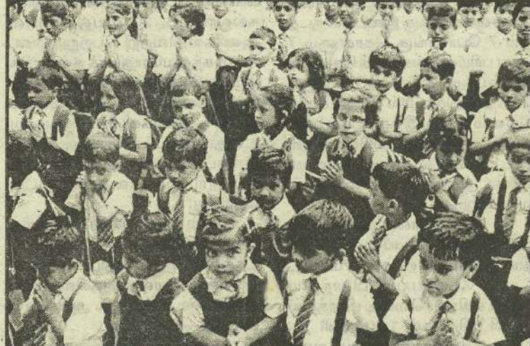
அயோத்தி வழக்கில் தீர்ப்பு வெளியான பின்னர் இந்தியாவில் அமைதி நிலவ வேண்டி உத்தரப்பிரதேசத்திலுள்ள பாடசாலை ஒன்றில் பிரார்த்தனை நடந்தது. இதில், அதிக எண்ணிக்கையான குழந்தைகள் கலந்து கொண்டனர்.

யவை வருமாறு - அயோத்தித் தீர்ப்புக்குப் பின்னர் மக்கள் அமைதி காக்க வேண்டும். சில விரும்பத்தகாத சக்திகள், இருவகுப்பினரிடையே பிளவை உண்டாக்கும் முயற்சியில் ஈடுபடுவதை மக்கள் முறியடிக்க வேண்டும். வதந்திகளைப் பரப்பு வோர் குறித்து எச்சரிக்கையாக இருக்க வேண்டும். இந்தியாவில் அமைதி, மத நல்லிணக்கத்தைப் பேணிக் காக்க அரசு முழுமூச்சுடன் உறுதி பூண்டுள்ளது. அதற்கு மக்கள் முழு ஒத்துழைப்பு அளிக்க வேண்டும். சமூகத்தில் பிளவை ஏற்படுத்த நினைக்கும் சக்திகளுக்கு மக்கள் அடிபணிந்துவிடக் கூடாது. - இப்படி அவர் கூறினார். (சி)