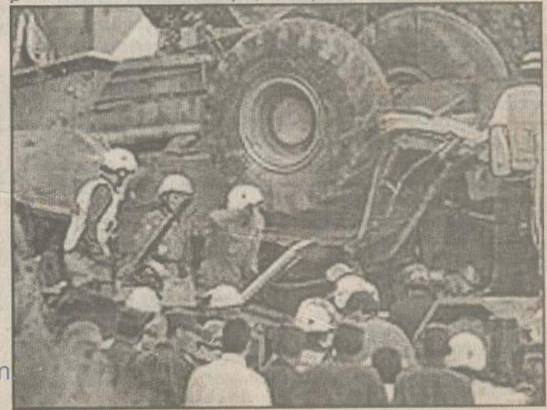
விபத்துக்குள்ளான புல்டோஸரும் பஸ்ஸும்

எனக் கூறினார். மெக்ஸிக்கோ அதிகாரிகள் அதை உறுதி செய்ய முயற்சிகள் மேற்கொண்டு வருகின்றனர்.