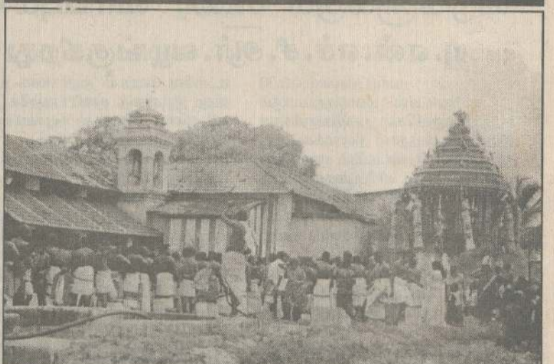
மாதகல் - பாணாவெட்டி ஸ்ரீபுவனேஸ்வரி அம்மன் ஆலயத்திருவிழாவின்போது ஸ்ரீபுவனேஸ்வரி அம்மன் தேரில் வித்யுலா வருவதைப் படத்தில் காலாணம்.