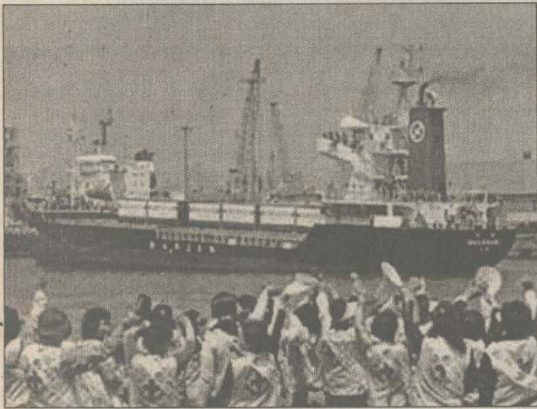
வடகொரியாவில் அண்மையில் கிடம்பெற்ற ரயில் விபத்தில் பாதிக்கப்பட்டவர்களுக்கான உணவுப்பொருள்களை தென்கொரியா அனுப்பிவைத்தது. தென்கொரியாவைச் சேர்ந்த நூறுக்கும் மேற்பட்ட தொண்டர்கள் உணவுப் பொருள்களுடன் கப்பல் மூலம் சீயோல் நகரிலிருந்து புறப்படும் காட்சி.