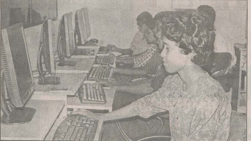
லண்டன் 'ஐ.ஆர்.வெக்' நிறுவனத்தின் அனுசரணையுடன் கிளிநொச்சி மாவட்ட தொழில்நுட்பக் கல்வி நிறுவனத்தில் தகவல் தொழில்நுட்பக் கற்கைநெறி அண்மையில் ஆரம்பமானது. இதன் ஆரம்பநாள் நிகழ்வில் கணினிகளுடன் பயிலுநர்கள் சிலர் அமர்ந்திருப்பதைப் படத்தில் காணலாம்.

வட்டக்கச்சி, ஜூலை 31 வட்டக்கச்சி பிரதேசத்தில் காணப்படும் பொதுக்கிணறுகளில் பெரும்பாலானவை நீண்டகாலமாகப் புனரமைக்கப்படாததால் பயன்படுத்தப்பட முடியாத நிலையிலுள்ளன. இதனால் மக்கள் குடிநீர் தண்ணீர் பெறுவதற்குப் பெரும் சிரமங்களை எதிர்நோக்கி வருகின்றனர் என்று தெரிவிக்கப்படுகின்றது. எனவே, சம்பந்தப்பட்ட அதிகாரிகள் இது விடயத்தில் அக்கறையுடன் செயற்பட்டுக் கிணறுகளைப் புனரமைக்க உரிய நடவடிக்கைகொடுக்க வேண்டும் என மக்கள் கேட்டுள்ளனர். (4-405-201)