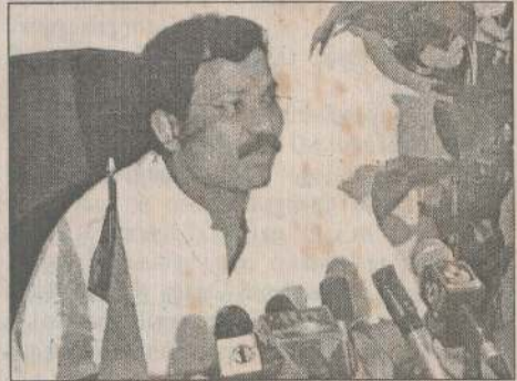
கிளிநொச்சி, நவ.2 சமாதானப் பேச்சுக்கள் இப்போதைக்கு ஆறம் பீக்கும் சாத்தியங்கள் தெரியவில்லை என்பதால், இரு தசாப்தங்களாகப் போரினால் அழிந்து