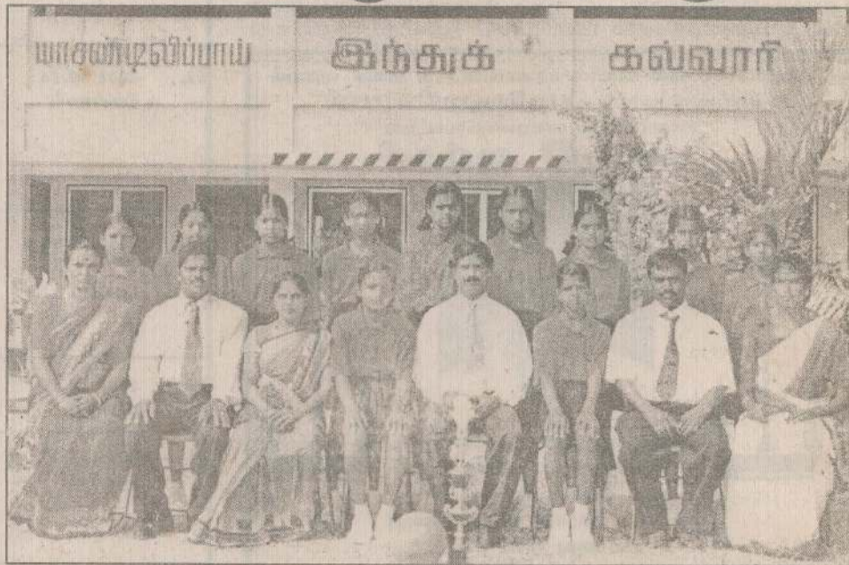
2004ஆம் ஆண்டு தேசிய மட்டப் போட்டியில் பங்குபற்றிய 15 வயதுப் பிரிவினர்.

1997ஆம் ஆண்டு முதல் 2004 வரை தொடக்கம் மகாணமட்டத்தில் பிரகாசித்து வருகின்ற இக்கல்லூரியின் வலைபந்தாட்ட அணியினர் இம்முறையும் (15வயதுப் பிரிவு) மாகாண மட்டத்தில் சம்பியனாகித் தேசிய மட்டப்போட்டியில் கால் இறுதியாட்டம் வரைக்கும் சென்று கல்லூரியின் பெயரை நிலைநாட்டியுள்ளனர்.