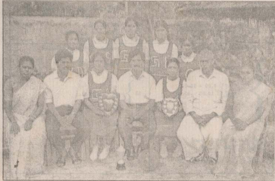
1993ஆம் ஆண்டு காலப்பகுதியில் வெற்றிகளைக் குவித்து பெருமை சேர்த்த வலைபந்தாட்ட அணியினர்.

கிராமப்பறத்தில் இன்று ஒரு பெரும் கல்லூரியாக வலைபந்தாட்டத்தில் வெற்றிகளைக் குவித்து வரும் இப்பாடசாலையின் வலைபந்தாட்ட அணியினர் தொடர்ந்தும் சாதனைகளை ஈட்டி தேசிய மட்டத்தில் ஜொலிக்க வேண்டுமென்று நாமும் உதயன் சார்பாக வாழ்த்துக்களைக் கூறுகின்றோம்.