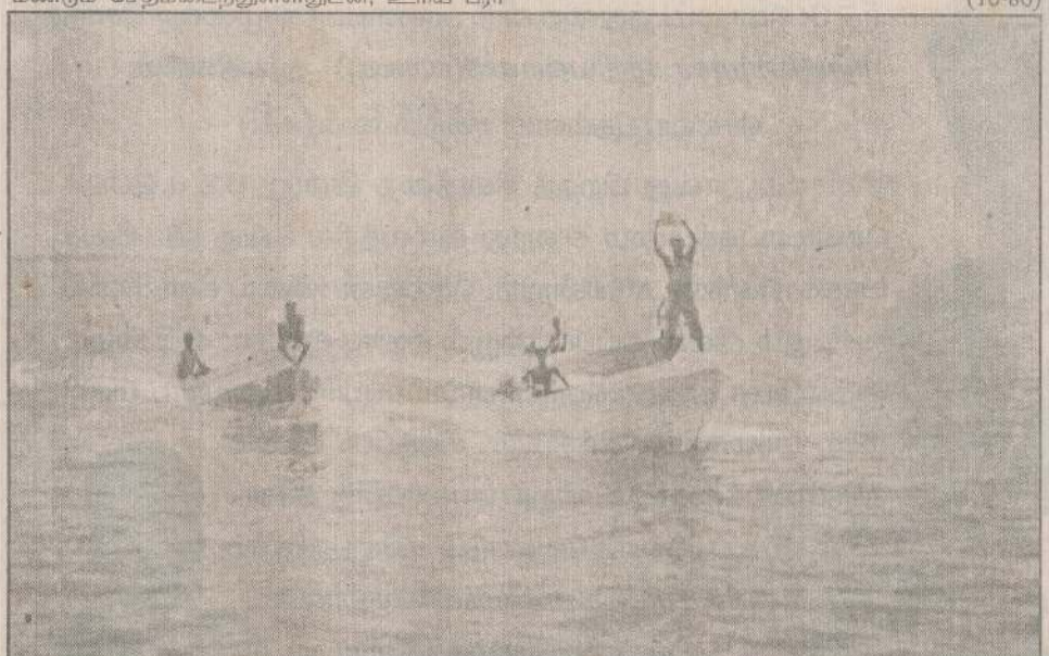
நெய்தல் விழாவையொட்டி குருநகர் கிரங்குபுறையே படகோட்டப் போட்டியில் முதலாம் இரண்டாம், மூன்றாம் இடங்களைப் பெற்றுக் கொள்ளும் குருநகர் கிரங்குபுறையை நோக்கிக் வந்துகொண்டிருப்பதைப் படத்தில் காணலாம்.

மைதானக் காவலாளிகள் வெளியார் விளையாடுவதைத் தடை செய்யாது விடுவதும் இதற்கு ஒரு காரணமாக அமைகின்றது. இம்மைதானத்தை நல்லமுறையில் பராமரிக்க வேண்டியது யாழ்ப்பாணம் மாநகர சபையின் கடமையாகும். விளையாட்டுக்கள் தெரிந்த ஒருவரை மைதானத்தின் பராமரிப்பாளராக யாழ்ப்பாணம் மாநகர சபை நியமனம் செய்வதன் மூலம் இம்மைதானத்தினை நல்லமுறையில் வைத்திருக்க வழியேற்படும் என விளையாட்டு வீரர்களும் ஆர்வலர்களும் கூறுகின்றனர். (10-86)