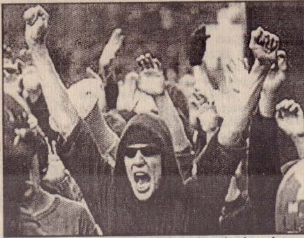
பிரான்ஸில் இடம்பெற்ற ஆர்ப்பாட்டம் ஒன்றின் காட்சி

நேற்றுக் காலை சுவின் நகரருகே உள்ள பிரதான வீதியில் சுமார் 1,500 பேர் மறியலில் ஈடுபட்டனர். அனிமஸி நகரிலிருந்து மேற்கு சுவின் பகுதி வரையிலான 10 கிலோ மீற்றர்கள் தூரத்துக்கு ஆர்ப்பாட்டப் பேரணி நடத்தியவர்களே இந்த வீதி மறியலில் ஈடுபட்டனர். அமெரிக்க அதிபர் ஜோஜ் புஷ் உட்பட உலகின் வளர்ந்த நாடுகளின் தலைவர்கள் சுவின் நகரில் கூட உள்ளனர். இந்த நிலையில் அங்கு உலகமயமாதலுக்கு எதிரானவர்களும் முதலாளித்துவ எதிர்ப்பாளர்களும் ஆர்ப்பாட்டங்களை நடத்திவருகின்றனர். இதனால், மாநாட்டில் பங்கேற்கும் தலைவர்களின் பாதுகாப்பு ஏற்பாடுகளில் நெருக்கடிநிலை உருவாகியுள்ளது.