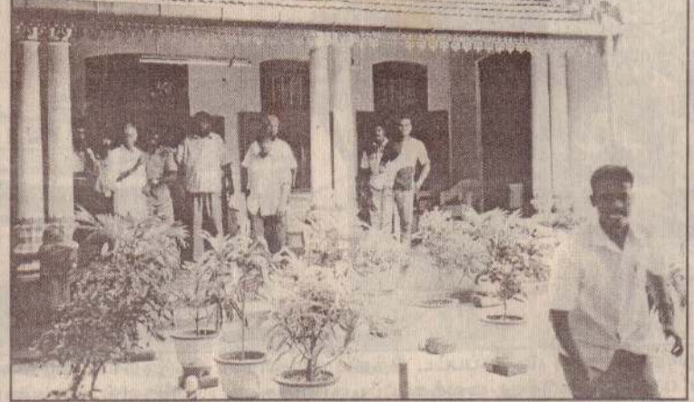
நேற்று உதயன் அலுவலகத்தில் இடம்பெற்ற சம்பவங்களைப் படப்பிடித்த அலுவலகப் படப்பிடிப்பாளரை நோக்கி சீற்றத்துடன் பாய்ந்தோடியவரும் சிறைக்காவலர்.