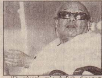
'டெஸ்மா' சட்டத்தின் 5ஆவது பிரிவின் கீழ் குற்றஞ்சாட்டப்படுவோருக்கு 3ஆண்டுகள் வரை சிறைத் தண்டனை. அல்லது 5 ஆயிரம் ரூபாய் அபராதம் அல்லது இரண்டு தண்டனைகளும் சேர்த்து வழங்கப்படும் என்பது குறிப்பிடத்தக்கது.