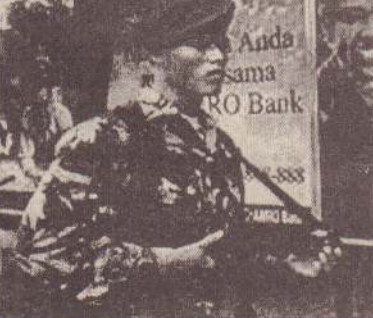
சுதந்திரதின் வைபவத்தில் கலந்துகொண்ட வெளிநாட்டு தூதர்களை அழைக்க முக்கியஸ்தர்கள் ஆகியோருக்குப் பலத்த பாதுகாப்பு வழங்கப்பட்டது.

ஐகார்த்தா, ஓக.18 இந்தோனேஷியாவின் சுதந்திரதின் விழா பலத்த பாதுகாப்புக்கு மத்தியில் நேற்று கொண்டாடப்பட்டது.