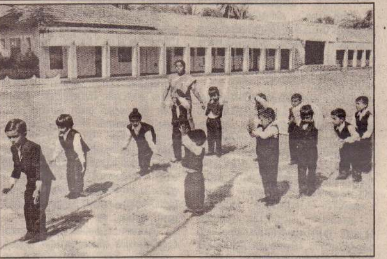
மாண்பியம் கோவில்பற்று இந்து சமய விருத்தி சங்க முன்பள்ளியின் வருடாந்த விளையாட்டு விழாவில் மாணவர்களின் வரவேற்பு நடனத்தைப் படத்தில் காணலாம். (ஒ-185)