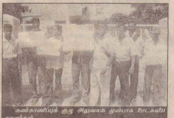
கண்காணிப்புக் குழு அலுவலக முன்பாக ஊடகவியலாளர்கள். (14ஆம் பக்கம் பார்க்க)

வருவது தெரிந்ததே. எதிர்காலத்தில் இப்படியான சம்பவங்களுக்கு இடமளிக்காமல் தடுப்பது தொடர்பாக ஆராயும் பொருட்டே விசாரணைக்குழு அனுப்பப்பட்டிருக்கிறது. இராணுவ வாகனங்களைச் செலுத்தும் சாரதிகளின் சாரதி அனுமதிப்பத்திரங்கள், அவை வழங்கப்பட்ட முறை மற்றும் தகுதியற்றவர்கள் வாகனங்களைச் செலுத்துதல் ஆகியவை தொடர்பாக இக்குழுவினர் விசாரணைகளை நடத்துவர். விசாரணைக்குழுவினருக்கு சகல ஒத்துழைப்புகளையும் வழங்குமாறும், யாழ்.இராணுவத் தளபதியைப் பாதுகாப்பு அமைச்சின் செயலாளர் பணித்திருக்கிறார். (14ஆம் பக்கம் பார்க்க)