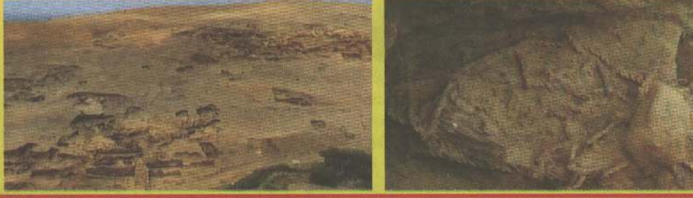
நாசா வெளியிட்ட பூமிக்கிரகத்தின் அழகான படங்கள்

அமெரிக்க கண்டத்திலேயே, பெருநாட்டில் உள்ள காரல் நகரம் மிகவும் பழமை வாய்ந்ததாகும். இந்நகரத்தில் உள்ள கடலோர கிராமம் ஒன்றில் நடைபெற்ற அகழ்வாராய்ச்சியில் 4 ஆயிரத்து 500 ஆண்டுகளுக்கு முந்தைய பெண் மம்மி கண்டுபிடிக்கப்பட்டுள்ளது. 40லிருந்து 50 வயது மதிக்கத்தக்க இந்த சடலம், விலங்குகள் உட்பட பல்வேறு பொருட்களுடன் அடக்கம் செய்யப்பட்டுள்ளது. இதன் மூலம், தன் சமூகத்தில் மிகச்சிறந்த அந்தஸ்தில் இந்த பெண் வாழ்ந்திருக்கலாம் என்று ஆராய்ச்சியாளர்கள் தெரிவித்துள்ளனர். இந்த மம்மி கண்டுபிடிக்கப்பட்டுள்ளதன் மூலம் மிகவும் தொன்மையான காரல் நகரிகம் குறித்து மேலும் தகவல்களை அறிந்துகொள்ள வாய்ப்புக் கிடைத்துள்ளதாகவும் ஆராய்ச்சியாளர்கள் கூறிபுள்ளனர்.