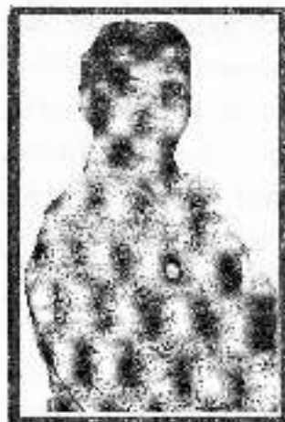
திரு. இலங்கை சிஸ்டர்ஸ்

உலகம் முழுவதும் தமிழ் பரவ வேண்டும் தமிழை மறந்த தமிழர்கள் மீண்டும் தமிழைப் படிக்க வேண்டும் அரிய வேண்டும். * ஸ்காலரிய ரீதியில் தமிழர்களிடையே ஒற்றுமை, நட்புறவு, தொடர்புறவு தேவையே வேண்டும் அதற்காக உ.த.ப. இயக்கம் பணியாற்ற வேண்டும் என்ற ஆழங்கத்தில்