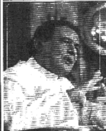
கனடா மாநில சபை உறுப்பினர் பிரதமர் டி.எம்.ஜெயரட்ணை சந்தித்து பேசும் போது

நாம் அவைவரும் இலங்கையர் என்ற அடிப்படையில் உள்நாட்டும் பிரகாரம் அவைவரையும் ஒன்றிவைப்பதே ஜனாதிபதியின் அடுத்த இலக்கு என்று கண்டியில் இடம்பெற்ற பாடசாலை மாணவர்களுக்கு இலங்கைப் பாடநூலை வழங்கும் தேசிய வைபவத்தில் பிரதமர் அதிபரியாகக் கலந்து உரையாற்றிய பிரதமர் டி.எம்.ஜெயரட்ண தெரிவித்தார்.