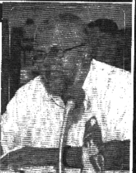
சட்ட அமைச்சர் டக்ளஸ் தேவானந்தா கருணாகலங்கையில் இடங்களை கையாடும் வகையில் செயல்படும்.

சிவில் நிர்வாகத்தில் காணப்படும் தேவையற்ற தலையீடுகளை படிப்படியாக நீக்குவதற்கு நடவடிக்கை எடுக்கப்படுமென மாண்புமிகு அமைச்சர் டக்ளஸ் தேவானந்தா உறுதிப்படுத்தினார். சிவில் நிர்வாகத்தில் காணப்படும் தேவையற்ற தலையீடுகளை படிப்படியாக நீக்குவதற்கு நடவடிக்கை எடுக்கப்படுமென மாண்புமிகு அமைச்சர் டக்ளஸ் தேவானந்தா உறுதிப்படுத்தினார்.