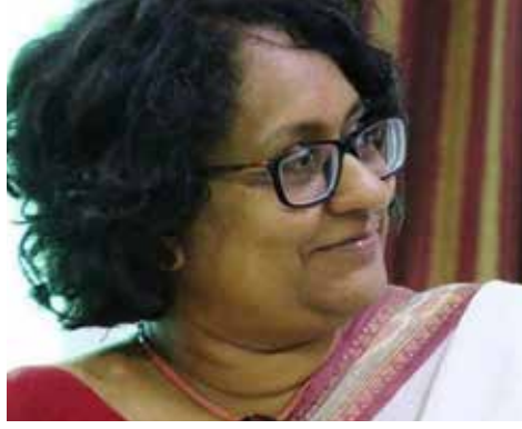
இலங்கையில் நான்கு பேர் கொண்ட குடும்பம் ஒன்றுக்கு ஒரு மாதத்துக்கு சத்தான

உணவை உண்பதற்கு ஒரு லட்சம் அல்லது ஒன்றரை லட்சம் ரூபா தேவைப்படுகின்றது. ஆகவே எத்தனை குடும்பங்களுக்கு இவ்வாறான வருமானம் கிடைக்கின்றது என எதிர்க்கட்சி நாடாளுமன்ற உறுப்பினர் ஹரிணி அமரகுரிய கேள்வி எழுப்பியுள்ளார்.