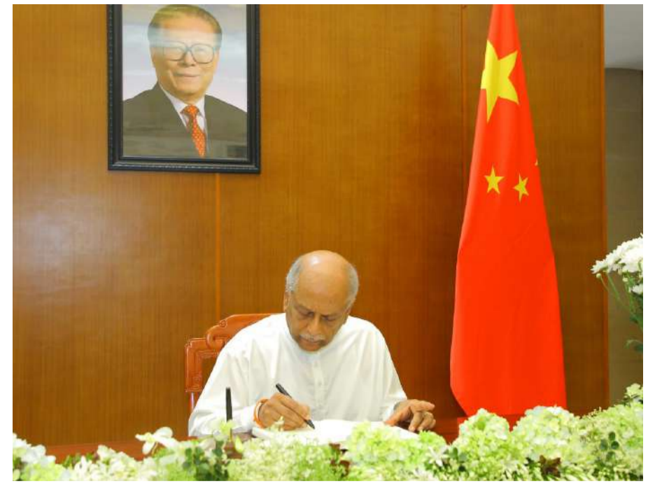
பிரதமர் தினைஷ் குணவர்தன முன்னாள் சீன ஜனாதிபதி ஜியாங் செமீனின் மறைவு குறித்து கொழும்பில் உள்ள சீன தூதுவராலயத்தில் வைக்கப்பட்டுள்ள அனுதாப புத்தகத்தில் கையொப்பமிட்ட போது எடுக்கப்பட்ட படம்.