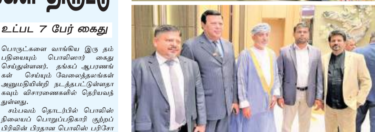
ஐக்கிய அரபு இராச்சியத்தின் 51ஆவது தேசிய தின விழா கொண்டாட்டம் அண்மையில் நடைபெற்றது. இந் நிகழ்வில் பல்வேறு நாடுகளின் இணக்கமான தூதர்கள், இராஜாங்க அமைச்சர்களான அ. அரவிந்ததாமர், காந்தர்மன் மற்றும் அரசியல் பிரமுகர்கள் பலரும் கலந்து கொண்டனர்.