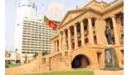
வின் பணிப்புரைக்கமைய ஆரம்பிக்கப்பட்டுள்ள

2021 (2022) ஆம் ஆண்டில் க.பொ.த சாதாரண தரப் பரீட்சையில் முதல் முறையாக தோற்றி ஓரே தடவையில் சித்தியடைந்து 2024 ஆம் ஆண்டில் க.பொ.த உயர்தரப் பரீட்சைக்குத் தோற்றவுள்ள, பொருளாதார பிரச்சினைகளை எதிர்கொண்டுள்ள மாணவர்களுக்கு புலமைப்பரிசில் வழங்கும் திட்டத்தை ஜனாதிபதி நிதியம் ஆரம்பித்துள்ளது. ஜனாதிபதி ரணில் விக்ரமசிங்க