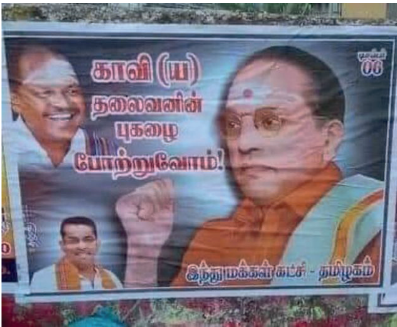
எதிர்ப்புத் தெரிவித்து விடுதலை சிறுத்தைகள், மார்க்சிஸ்ட் கம்யூனிஸ்ட் உள்ளிட்ட கட்சிகள் போராட்டத்தில் ஈடுபட்டன. இதனையடுத்து இப்போஸ்டர்

இந்தியர்களால் அனுசரிக்கப்பட்டது. இதனையொட்டி பல்வேறு அரசியல் கட்சிகளைச் சேர்ந்தவர்கள் அம்பேத்கரின் சிலை மற்றும் படத்திற்கு மாலை அணிவித்து மரியாதை செலுத்தினர். இந்நிலையில் தஞ்சை மாவட்டம் கும்பகோணத்தில், இந்து மக்கள் கட்சி சார்பில், ஒட்டப்பட்ட போஸ்டரில் 'காவி(ய) தலைவனின் புகழை போற்றுவோம்' என எழுதப்பட்டிருந்ததோடு காவி உடை, விபூதி பூசி, குங்குமம் வைக்கப்பட்ட அம்பேத்கரின் உருவப்படமும் அச்சிடப்பட்டிருந்தது. இப்போஸ்டரானது அப்பகுதியில் பெரும் பரபரப்பை ஏற்படுத்தியிருந்த நிலையில், இதற்கு