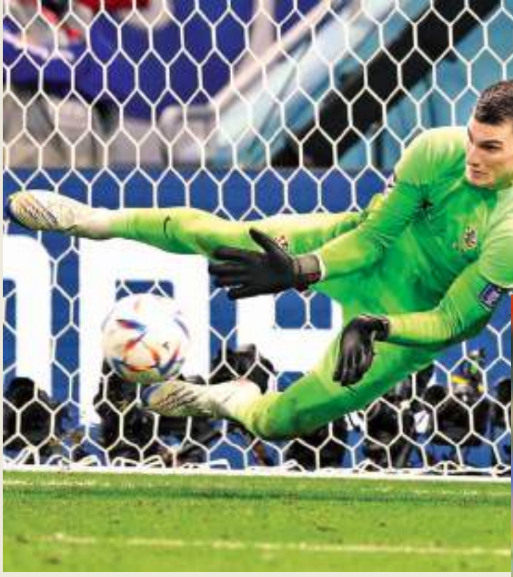
தென் கொரியாவுக்கு எதிரான நொக் அவுட் சுற்று போட்டியில் 4-1 என்ற கோல் வித்தியாசத்தில் அதிரடி வெற்றியீட்டிய பிரேசில் அணி உலகக் கிண்ண கால்பந்து தொடரின் காலிறுதியில் குரோசியாவுடன் மோதவுள்ளது.

அவுட் போட்டியில் ஜப்பானை பெனால்டி குட் அவுட் முறையில் 3-1 என்ற கோல் வித்தியாசத்தில் தோற்கடித்தது. இந்த இரு அணிகளுக்கும் இடையிலான போட்டி முழு நேரம் மற்றும் வழங்கப்பட்ட 30 நிமிட மேலதிக நேரத்தில் 1-1 என சமநிலை பெற்றிருந்தது. முடிவை தீர்மானிக்க பெனால்டி குட் அவுட் முறை பயன்படுத்தப்பட்டபோதும் ஜப்பானின் முதல் இரு உதைகளையும் தடுத்த குரோசிய கோல் காப்பாளர் டொமினிக் லிவகோவிச் தொடர்ந்து மற்றொரு பெனால்டி முயற்சியையும் முறியடித்தார்.