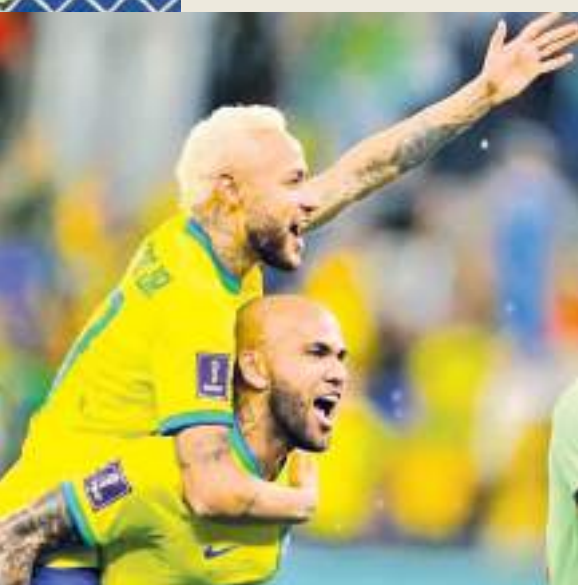
இதன்போதும் காயத்தின் பின் அணிக்குத் திரும்பிய நெய்மார் பெனால்டி உதவியுடன் கோல் புகுத்தினார். இது பிரேசில் அணிக்காக நெய்மார் பெறும் 76 ஆவது கோலாக இருந்தது. தோடு பிரேசில் சார்பில் அதிக கோல்கள் பெற்ற பீலேவின் சாதனையை சமன் செய்ய அவருக்கு இன்னும் ஒரு கோலே எஞ்சியுள்ளது.

அவுட் போட்டியில் ஜப்பானை பெனால்டி குட் அவுட் முறையில் 3-1 என்ற கோல் வித்தியாசத்தில் தோற்கடித்தது. இந்த இரு அணிகளுக்கும் இடையிலான போட்டி முழு நேரம் மற்றும் வழங்கப்பட்ட 30 நிமிட மேலதிக நேரத்தில் 1-1 என சமநிலை பெற்றிருந்தது. முடிவை தீர்மானிக்க பெனால்டி குட் அவுட் முறை பயன்படுத்தப்பட்டபோதும் ஜப்பானின் முதல் இரு உதைகளையும் தடுத்த குரோசிய கோல் காப்பாளர் டொமினிக் லிவகோவிச் தொடர்ந்து மற்றொரு பெனால்டி முயற்சியையும் முறியடித்தார்.