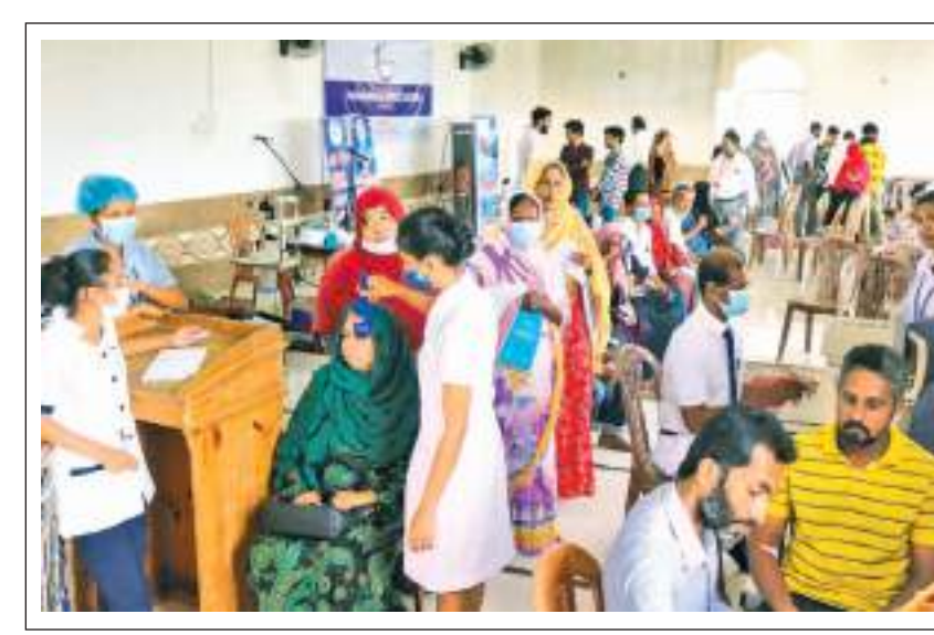
மாவனல்லை "எசோ ஸிபேசன் போ பிடன்" ஏற்பாட்டில் இலவச மருத்துவ முகாமொன்று, மாவனல்லை புளூபிடிய தக்கியாவில் அண்மையில் நடைபெற்றது. இவ் நிகழ்வில், இலவச சிறுநீர் மற்றும் கிரத்த மருத்துவ பரிசோதனைகளும் இலவச கண் பரிசோதனைகள் நிகழ்வும் நடைபெற்றதை படத்தில் காணலாம்.