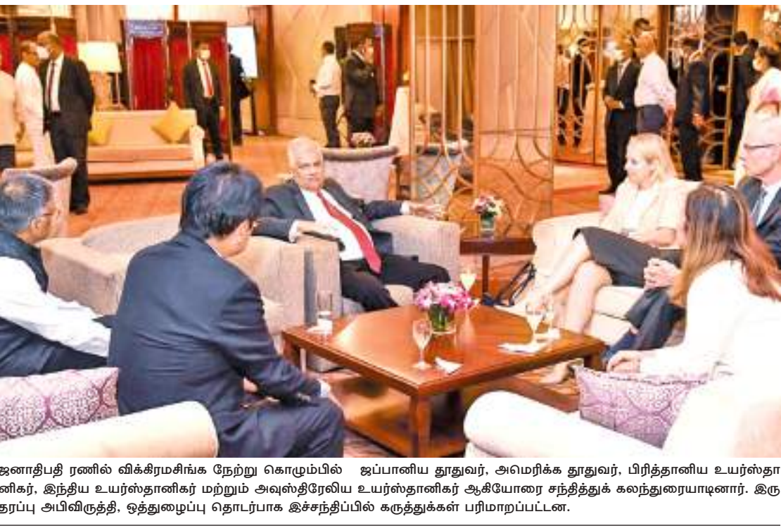
ஜனாதிபதி ரணில் விக்கிரமசிங்க நேற்று கொழும்பில் ஜப்பானிய தூதரவை, அமெரிக்க தூதரவை, பிரித்தானிய உயர்ஸ்தானிகர், இந்திய உயர்ஸ்தானிகர் மற்றும் அவுஸ்திரேலிய உயர்ஸ்தானிகர் ஆகியோரை சந்தித்துக் கலந்துரையாடினார். இரு தரப்பு அபிவிருத்தி, ஒத்துழைப்பு தொடர்பாக இச்சந்திப்பில் கருத்துக்கள் பரிமாறப்பட்டன.

இணையத்தளத்தில் முதல் முறையாக சிங்களம், தமிழில் Domain Name Dot இலங்கை, Dot லங்கா லேக்ஹவுஸ் முதலாவதாக இணைவு இந்நாட்டின் இணையதள வரலாற்றிலேயே விசேட மைல் கல்லாக அடையாளப்படுத்தி வந்த தளத்தையே (Domain Name) சிங்கள மற்றும் தமிழ் மொழியில் (Dot Lanka (இல) and Dot illangai (இலங்கை). நேற்று முதல் பெற்றுக் கொள்ள முடியும். இந்நாட்டின் மிகப்பெரிய ஊடக நிறுவனமான லேக் ஹவுஸ் நிறுவனம் இந்நாட்டின் ஊடக நிறுவனங்களிடையே விசேட இடத்தை பெற்று நேற்று முதல் இந்த தொழில்நுட்பத்தடன் இணைந்து கொண்டது. அதன்படி லேக்ஹவுஸ் நிறுவனம் தனது வெளியீடுகளுக்கு உரிய Domain பெயரை சிங்கள மற்றும் தமிழ் மொழிகளில் முன் வைக்கும். 04