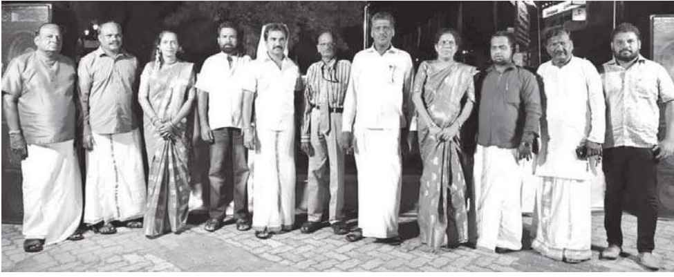
கலை கலாசார நிகழ்வுகள் நடைபெற்று வந்தமை மக்கள் மத்தியில் மிகுந்த பாராட்டைப் பெற்று வந்திருந்தது.

மக்கள் விடுமுறை நாட்களைக் கழிப்பதற்காக மட்டக்களப்பு நகரின் இதயமெனக் கருதப்படும் காந்தி பூங்காவிற்கு வருகின்றனர். அங்கே அரங்கமைத்து இயல் இசை நாடகக்