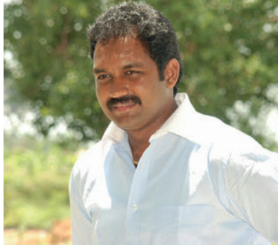
தலைவர் செந்தில் தொண்டமான் பணிப்புரை விடுத்துள்ளார். வீடுகளுக்கு ஏற்பட்டுள்ள சேதம் காரணமாக பாதிக்கப்பட்டுள்ள மக்களை மாற்று இடங்களில்

பசறை, லுணுகலை பகுதிகளில் பலத்த காற்று காரணமாக பாதிக்கப்பட்டுள்ள மக்களுக்கு உடனடி மாற்று நடவடிக்கைகள் குறித்து செந்தில் தொண்டமான் மாவட்ட அதிபருக்கு பணிப்புரை விடுத்துள்ளார். பசறை, லுணுகலை உட்பட்ட தோட்டப் பகுதிகளில் நேற்றுமுன்தினம் (07) இரவுமுதல் திடீரென வீசிவரும் பலத்த காற்று காரணமாகப் பாதிக்கப்பட்டுள்ள மக்களுக்கு உடனடியாக உதவிகளை வழங்குமாறு மாவட்ட அதிபருக்கு இ. தொ.கா