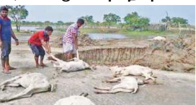
கந்தளாய், மூதூர் தினகரன், தோப்பூர் குறாப் நிருபர்கள்

தோப்பூரில் குளிரால் உயிரிழந்த சுமார் 50 மாடுகள் புதைப்பு