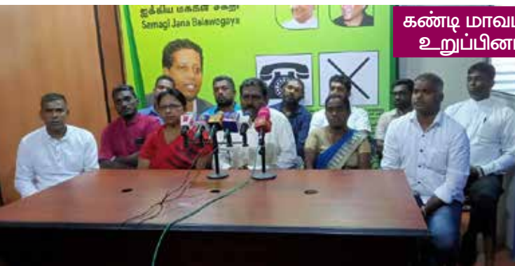
கண்டி மாவட்ட உள்ளூராட்சி சபைகளின் உறுப்பினர்கள் கூட்டாகக் கோரிக்கை