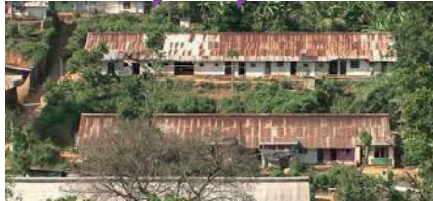
பதுளை, நுவரெலியா, காலி, மொனாராகலை, கண்டி, கண்துறை, ஹம்பாந்தோட்டை உள்ளிட்ட மாவட்டங்களில் பிரதேச செயலாளர்களின் கண்காணிப்பின் கீழ் இந்த வேலைத்திட்டம் முன்னெடுக்கப்படுகிறது.

மாத்தளையில் 1,279 ஆகவும், 2,089 வீடுகள் நுவரெலியாவிலும், கண்டியில் 2,001 வீடுகளும் காணப்படுகின்றன என்றார். மேற்படி வீடுகளில் வாழ்வோரை வேறு இடங்களில் குடியமர்த்துவதற்கான வேலைத்திட்டங்கள் தயாரிக்கப்பட்டுள்ளதாகவும், இதற்காக அதிக ஆபத்தான பகுதிகளில் உள்ள வீடுகளை பாதுகாப்பான இடங்களுக்கு குடியமர்த்த வேண்டுமென தேசிய கட்ட ஆராய்ச்சி நிறுவகத்தால் அடையாளம் காணப்பட்டுள்ள குடும்பங்களுக்கு புதிய வீடுகளை அமைத்துக் கொடுப்பதற்கான வேலைத்திட்டங்கள் 2019 ஆம் ஆண்டு ஆரம்பிக்கப்பட்டுள்ளன என்றார்.