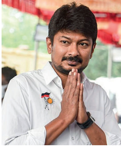
விளையாட்டுத்துறையே உதயநிதி ஸ்டாலினுக்கு ஒதுக்கப்பட்டிருந்தமை குறிப்பிடத்தக்கது.

இந்நிலையில், புதிதாக பதவியேற்றுள்ள உதயநிதி ஸ்டாலினுக்கு இளைஞர் நலன் மற்றும் விளையாட்டு மேம்பாட்டுத்துறை ஒதுக்கப்பட்டுள்ளதாகத் தெரிவிக்கப்பட்டுள்ளது. அமைச்சர் மெய்யநாதனிடம் கூடுதலாக இருந்த