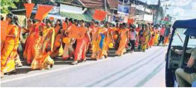
வடமராட்சி தெற்கு, மேற்கு பிரதேச செயலகத்தினால் பால்நிலை வன்முறையை கண்டித்து நெல்வியடி நகரப்பகுதியிலிருந்து ரேணியொன்று நேற்று வியாழக்கிழமை (15) முற்பகல் இடம்பெற்றது. பால்நிலை வன்முறைக்கு எதிராக 16 நாள் செயற்பாட்டில் இடம்பெற்ற இப்பேரணியில் அரசு உத்தியோகத்தர்கள் ஒவ்வொரு கிராம சேவையாளர் பகுதியிலும் உள்ள பணிகள், உதவி பிரதேச செயலாளர் உட்பட உத்தியோகத்தர்கள் நெல்வியடி வந்தக சங்கத்தினர் மற்றும் பொதுமக்கள் இந்நிகழ்வில் கலந்து கொண்டனர். நெல்வியடி நகரிலிருந்து ஆரம்பமான பேரணி, பிரதேச செயலகம் வரை சென்று அங்கு கண்டன கூட்டம் நடைபெற்றது. (கரவெட்டி தினகரன், நாகர்கோவில் விசேட நிருபர்கள்)

வான்கள், பொல்லுகள் கொண்டு இரு தரப்பினரும் தாக்குதலில் ஈடுபட்டதாக தெரிவிக்கப்படுகிறது. இதில் 7 பேர் காயமடைந்த நிலையில் வைத்தியசாலையில் அனுமதிக்கப்பட்டுள்ளனர். ஒன்றரை வயது ஆண் குழந்தை, 18 வயது யுவதி ஒருவர் உட்பட 32, 38, 22, 21, 40 வயதுகளையுடைய 5 ஆண்கள் என ஏழுபேர் காயமடைந்த நிலையில் பருத்தித்துறை ஆதர வைத்தியசாலையில் அனுமதிக்கப்பட்டு இருவர் மேலதிக சிகிச்சைக்காக யாழ். போதனா வைத்தியசாலைக்கு மாற்றப்பட்டுள்ளனர்.