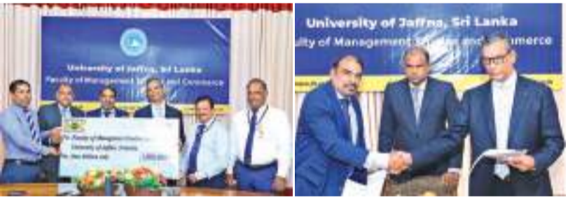
இரண்டு பட்டப்படிப்புகளிலும் முன்னணி பெறும் மாணவர்களுக்கு வருடாந்தப் பட்டமளிப்பு விழாவின் போது இலங்கை வங்கியினால் "இலங்கை வங்கி விருது" வழங்கப்பட்டுள்ளது. இதற்கான உடன்படிக்கையில் கைச்சாத்திடும் நிகழ்வு, நேற்றைய தினம்

யாழ்ப்பாணம் பல்கலைக்கழக முகாமைத்துவக் கற்கைகள் வணிக பீடத்தில் தொழில் நிருவாகமானி, வணிகமானி ஆகிய பட்டங்களைப் பெறும் மாணவர்களுக்கு வருடாந்தம் தங்கப் பதக்கத்தையும், சான்றிதழையும் வழங்குவதற்கென இலங்கை வங்கியினால் ரூபா பத்து இலட்சம் இலங்கை வங்கி திருநெல்வேலி கிளையில் யாழ்ப்பாணம் பல்கலைக்கழகத்தின் பெயரில் வைப்பிலிடப் பட்டுள்ளது. இந்த நிதியிலிருந்து ஒவ்வொரு வருடமும் இலங்கை வங்கி விருதுக்கான தங்கப்பதக்கமும், சான்றிதழும் வழங்கப்படவுள்ளன.