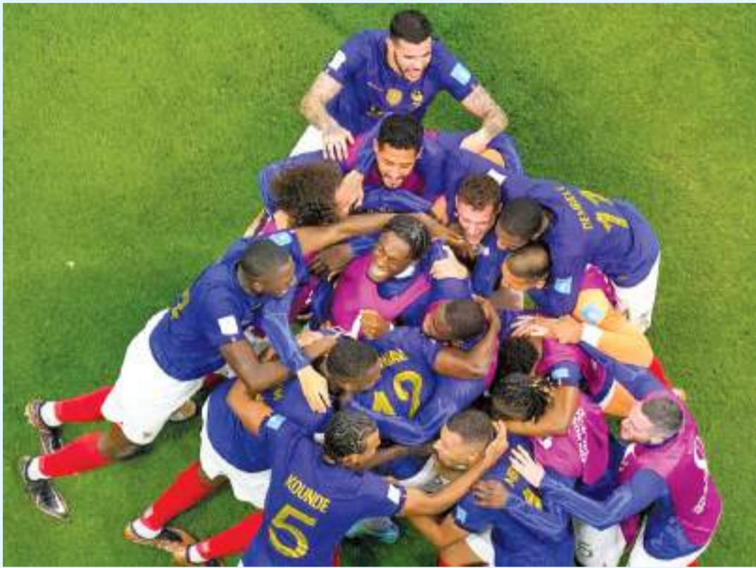
உலக சம்பியனான லியோனல் மெஸ்ஸியின் ஆர்ஜன்டீனாவை எதிர்கொள்ளவுள்ளது. 1962இல் பிரேசிலுக்குப் பின்னர் உலகக் கிண்ணத்தை தொடர்ச்சியாக வெல்லும் எதிர்பார்ப்புடனேயே பிரான்ஸ் இறுதிப் போட்டியில் களம் நிற்கவுள்ளது.

உலகக் கிண்ண கால்பந்து அரையிறுதிப் போட்டியில் மொரோக்கோவை 2-0 என்ற கோல் கணக்கில் வீழ்த்தி ஆர்ஜன்டீனாவடனான இறுதிப் போட்டிக்கு நடப்புச் சம்பியன் பிரான்ஸ் தகுதி பெற்றுள்ளது. கட்டாரின் அல் பைத் அரங்கில் இலங்கை நேரப்படி நேற்று (15) அதிகாலை நடைபெற்ற அரையிறுதிப் போட்டியில் ஐந்தாவது நிமிடத்தில் லேயே தியோ ஹெர்னாண்டஸ் கோல் பெற்றது பிரான்ஸ்வை வலுப்பெறச் செய்தது. மொரோக்கோ கோல்கம்பத்திற்கு அருகில் தள்ளுமுள்ள ஏற்பட தன்னிடம் வந்த பந்தை ஹெர்னாண்டஸ் கோலாக மாற்றினார். இதன்மூலம் உலகக் கிண்ண அரையிறுதிப் போட்டியில் 1958க்குப் பின்னர் வேகமாக கோல் பெற்றவராக ஹெர்னாண்டஸ் பதிவானார். தொடர்ந்து பதில் கோல் திருப்ப மொரோக்கோ கடுமையாகப் போராடியது. போட்டியின் அதிக நேரம் மொரோக்கோவிடமே பந்து சுழன்றது. எனினும் பிரான்ஸ் மொரோக்கோவின் எதிர் பார்ப்பை 79ஆவது நிமிடத்தில் முழுமையாக சிறுபடுத்தி. மொரோக்கோ பெனால்டி பகுதிக்குள் மப்பே கடத்தி வந்த பந்தை கோலோ முவானி கோலாக மாற்றினார். ஒஸ்மான் டம்பெலேவுக்கு பதில் மைதானம் வந்து வெறுமனே 44 நிமிடங்களிலேயே அவர் அந்த கோலை பதிவு செய்தார். இது உலகக் கிண்ண வரலாற்றில் பதில் வீரராக வந்து பெறப்பட்ட இரண்டாவது வேகமான கோலாக இருந்தது. இதன்படி வரும் ஞாயிறுக்கிழமை (18) நடைபெறவுள்ள உலகக் கிண்ண இறுதிப் போட்டியில் பிரான்ஸ் அணி 1978 மற்றும் 1986இன்