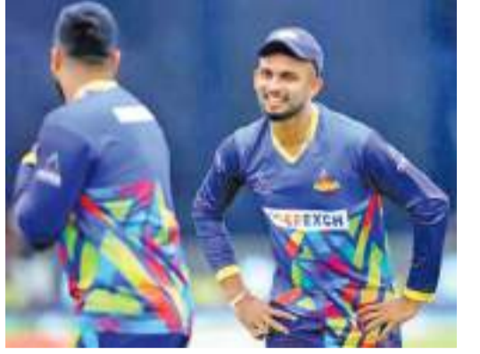
8 விக்ரெட்டுகளை இழந்து 160 ஓட்டங்களை பெற்றநிலையில் பதிலெடுத்தாடிய ஜப்பா அணி 20 ஓவர்கள் முடிவில் 9 விக்ரெட்டுகளை இழந்து 150 ஓட்டங்களையே பெற்றது. வலிந்து ஹசரங்க தலைமையி லான கண்டி அணி இந்தத் தொடரில் இதுவரை 6 போட்டிகளில் ஆடி ஐந்தில் வெற்றியீட்டியமை குறிப்பிடத்தக்கது. இதன்மூலம் கண்டி அணி 10 புள்ளிகளுடன் முதலிடத்தில் நீடிப்பதோடு ஜப்பா அணி 8 புள்ளிகளுடன் இரண்டாவது இடத்தில் உள்ளது.

லங்கா பிரீமியர் லீக் தொடரில் கொழும்பு ஸ்டார்ஸ் அணிக்கு எதிரான போட்டியிலும் தோல்வியை சந்தித்த தம்புள்ள அவ்வா தொடர்ச்சியாக ஐந்தாவது தோல்வியை எதிர்கொண்டுள்ளது. பல்லேகலவில் புதன் கிழமை (14) இரவு நடைபெற்ற போட்டியில் முதலில் துடுப்பெடுத்தாடிய தகன் ஷானக்க தலைமையி லான தம்புள்ள 89 ஓட்டங்களுக்கே சுருண்டது. கொழும்பு ஸ்டார் 11.3 ஓவர்களில் ஒரு விக்ரெட்டை பெற்ற இலக்கை எட்டியது. இதன்போதும் சரித அசலங்க 36 பந்துகளில் ஆட்டமிழக்காது 58 ஓட்டங்களை பெற்றமை குறிப்பிடத்தக்கது. இதேவேளை புதன்கிழமை நடைபெற்ற மற்றொரு போட்டியில் நடப்புச் சம்பியன் ஜப்பா கிங்ஸ் கண்டி பெல்கோன்ஸ் 10 விக்ரெட்டுகளால் வீழ்த்தியது. இதன்போது முதலில் துடுப்பெடுத்தாடிய கண்டி அணி 20 ஓவர்களுக்கும்