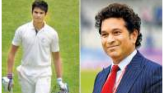
அணிக்காக களமிறங்கியபோது அந்த ஆட்டத்தில் சதம் பெற்றார் என்பது குறிப்பிடத்தக்கது. 2013 ஆம் ஆண்டு சர்வதேச கிரிக்கெட் போட்டிகளில் இருந்து சச்சின் ஓய்வுபெறும்போது டெஸ்ட் போட்டிகளில் 51 சதம் மற்றும் ஒருநாள் சர்வதேச போட்டிகளில் 49 சதம் என சரியாக 100 சதங்களே பெற்றார் என்பது குறிப்பிடத்தக்கது.

சச்சின் டெண்டுல்கரின் மகன் ஆர்ஜன் டெண்டுல்கர் தனது தந்தையின் பாணியில் தனது கன்னி முதல்தர போட்டியிலேயே சதம் பெற்றுள்ளார். ராஜஸ்தான் அணிக்கு எதிரான போட்டியில் கோவா அணிக்காக 23 வயதான ஆர்ஜன் 207 பந்துகளில் 120 ஓட்டங்களை பெற்றுள்ளார். பிரதான பந்துவீச்சாளராக இருக்கும் ஆர்ஜன் ஏழாவது வரிசையில் களம் நிற்கி மூன்று இலக்க ஓட்டங்களை பெற்றதன் உதவியோடு கோவா அணி ரஞ்சி கிண்ண போட்டியில் 8 விக்ரெட்டுகளை இழந்து 493 ஓட்டங்களே பெற்றது. 1988இல் சச்சின் தனது 15 வயதில் கன்னி முதல் தர போட்டியில் மும்பை