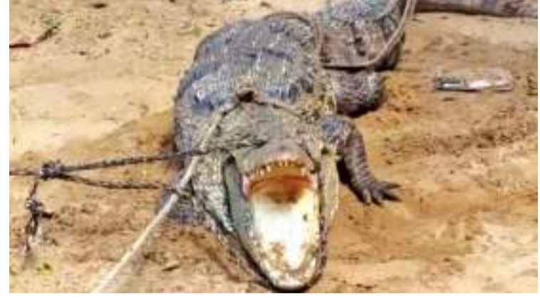
யாழ்.விசேட, சாவகச்சேரி விசேட நிருபர்கள்

யாழ்ப்பாணம் சாவகச்சேரியில் இரண்டு நாய்களை உயிருடன் விழுங்கிய முதலை ஊரவர்கள் மடக்கி பிடித்துள்ளனர். முதலை எட்டடி நீளமானது என தெரிவரவு கிடைத்தது. சாவகச்சேரி சிவன் கோவில் வழியில் உள்ள விருந்தினர் விடுதி ஒன்றினால் நேற்று முன்தினம் புதன் கிழமை இரவு உட்புகுந்த கூடர் எட்டடி நீளமான முதலை நாய்கள் இரண்டை விழுங்கி விட்டு அசைய முடியாத நிலையில் அங்கேயே உறங்கியுள்ளது. விடுதி பணியாளர்கள் காலையில் நாய்களை காணவில்லை என தேடிய போது, விடுதி வளாகத்தில் முதலை ஒன்று உறக்கத்தில் இருப்பதை கண்டுபிடித்துள்ளனர். பின்னர் அயலவர்களின் உதவியுடன் முதலையை உயிருடன் பிடித்து மர எட்டடி நீளமானது என தெரிவரவு கிடைத்தது. சாவகச்சேரி சிவன் கோவில் வழியில் உள்ள விருந்தினர் விடுதி ஒன்றினால் நேற்று முன்தினம் புதன் கிழமை இரவு உட்புகுந்த கூடர் எட்டடி நீளமான முதலை நாய்கள் இரண்டை விழுங்கி விட்டு அசைய முடியாத நிலையில் அங்கேயே உறங்கியுள்ளது. விடுதி பணியாளர்கள்