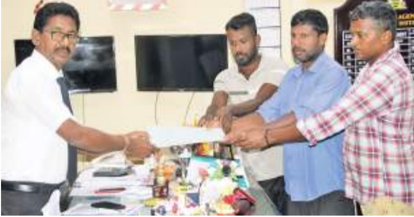
போடும் மாடுகளை கடத்திச் சென்று இறைச்சி விற்பனை நடைபெறுவதாக கால்நடைவளர்ப்போர் குற்றம் சாட்டுகின்றனர். எனவே அவற்றை கட்டுப்படுத்த நடவடிக்கை எடுக்கவேண்டுகிறோம். இவர்கள் கோரிக்கை விடுத்துள்ளனர். ஒருசில மாதங்களுக்குள் 47 மாடுகள் கடத்தப்பட்டிருக்கின்றன. கால்நடை வளர்ப்போர் தெரிவித்துள்ளனர். இதற்கு பதிலளித்த மாவட்ட அரசாங்க அதிபர் உடனடியாக தாம் பொலிஸாருடனும் பிரதேச சபை தவிசாளருடனும் கதைத்து அதற்கான நடவடிக்கை மேற்கொள்வதாக உறுதியளித்தார்.