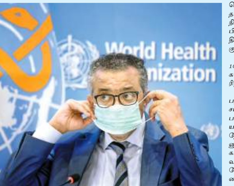
அறிவிக்கப்பட்டதன் மூலமே நோய்க்கான சிகிச்சை மற்றும் தடுப்பூசியை பகிர்வதற்கான சர்வதேச ஒத்துழைப்பு மற்றும் நிதி சேகரிக்க முடிந்தமை குறிப்பிடத்தக்கது.

அடுத்த ஆண்டில் கொவிட் தொற்று தொடர்ந்தும் உலகளாவிய சுகாதார அவரச நிலையாக இருக்காது என்று உலக சுகாதார அமைப்பு நம்பிக்கை தெரிவித்துள்ளது. கொவிட்-19 அவசரநிலையை முடிவுக்குக் கொண்டுவரும் பிரகடனம் குறித்து உலக சுகாதார அமைப்பின் கொவிட்-19 அவசரக் குழுக் கூட்டம் அடுத்த மாதம் நடத்தப்படவுள்ளதாக ஜெனீவாவில் கடந்த புதனன்று (14) நடந்த செய்தியாளர் மாநாட்டில் அந்த அமைப்பின் பணிப்பாளர் நாயகம் டெட்ரோஸ் அதனொம் கெப்ரியேசஸ் தெரிவித்தார். "அடுத்த ஆண்டின் ஒரு கட்டத்தில் கொவிட்-19 உலகளாவிய சுகாதார அச்சுறுத்தல் இல்லை என்று எம்மால் கூற முடியுமா இருக்கும்" என்று அவர் தெரிவித்தார். எனினும் கொவிட்-19 தொற்றுக்குக் காரணமான 'சார்ஸ்-கொவ்-2' வைரஸ் அழிந்துவிடாது என்று அவர் சுட்டிக்காட்டினார். "இந்த தொற்றுடன் பல நாடுகளிலும் தற்போது தீவிரமாக பரவியிருக்கும் காய்ச்சல் மற்றும் ஆர்.எஸ்.வி. (சுவாச நுண்குழல் அலர்ஜி வைரஸ்) உட்பட்ட சுவாச நோய்களை கையாள்வதற்கு அனைத்து நாடுகளும் கற்றுக்கொள்ள வேண்டும்" என்றும் கெப்ரியேசஸ் கூறினார். கடந்த 2020ஆம் ஆண்டு ஜனவரி முடிவில்