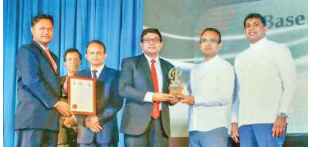
தேசிய உற்பத்தித்திறன் செயலகத்தால் ஏற்பாடு செய்யப்பட்ட தேசிய உற்பத்தித்திறன் விருது வழங்கும் நிகழ்வு பிரதமர் திணைவு குணவர்தன தலைமையில் நேற்று (15) அலறி மானிக்கையில் நடைபெற்றது. தேசிய உற்பத்தித்திறன் போட்டியில் அரசு பிரிவின் கீழ் அரசு நினைக்கக்கூடிய கருவிகளில் சம்மாந்துறை ஆதார வைத்தியசாலை மூன்றாம் இடத்தை பெற்றுக் கொண்டது. சம்மாந்துறை ஆதார வைத்தியசாலையின்