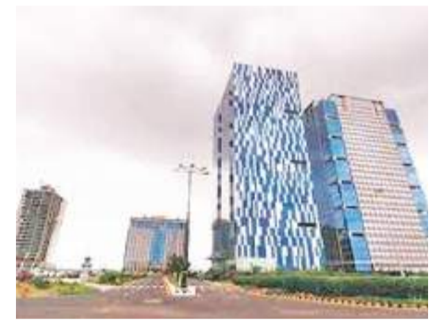
தொழில்வாய்ப்பு திட்டத்தின் கீழ் 16,807 தொழில்கள் ஆரம்பிக்கப்பட்டன. விவசாய மற்றும் உணவு பதப்படுத்தல் பிரிவில் கீழ்க்கேட்டு தொழில் முயற்சிகள் மேற்கொள்ளப்பட்டுள்ளன. இந்தத்திட்டத்தின் கீழ் தொழிலாளர் தரத்தில் இருந்தவர்களும், சிறு தொழில்களை நடத்தி வந்தவர்களும் அரசு கட்ட உதவிகளைப் பெற்று சிறுதொழில் அடிப்படையாக வரமுடிந்திருப்பதாக காஷ்மீர் நிர்வாக வட்டாரங்கள் சுட்டிக் காட்டுகின்றன. தீவிரவாதிகளின் நடமாட்டம் தொடக்கக் கட்டிய பரமுல்லா, புல்வாமா, கண்டர்பால், பன்டி போரா மாட்டங்களில் தொழில் முயற்சிகள் 2122 காலப்பகுதியில் ஆரம்பிக்கப்பட்டன. கடந்த மற்றும் கிராம கைத்தொழில் சபையும் இளம் தொழில்முயற்சியாளர்களுக்கு தொழில் பயிற்சி, வழிகாட்டல்களுடன் கடன்களையும் வழங்கி வருகிறது.

ஜம்மு காஷ்மீரில் வெற்றிகரமாக தொழில் முயற்சிகளில் ஈடுபட்டுள்ள தொழில் முயற்சியாளர்களை ஊக்குவிக்கும் முகமான பிரதமரின் தொழில் வாய்ப்பு விருதுகளுக்கான போட்டியாளர்களைத் தெரிவு செய்யும் விண்ணப்பங்கள் கோரப்பட்டுள்ளன. மத்திய அரசின் சிறு மற்றும் நடுத்தர தொழில் முயற்சிகளுக்கான அமைச்சர் விண்ணப்பங்களை கோரியுள்ளது. ஜம்மு - காஷ்மீரில் மாநில அந்தஸ்து குறைக்கப்பட்டதோடு விசேட அந்தஸ்தும் நீக்கப்பட்ட பின்னர் புதிய முதலீடுகள், புதிய தொழில்முயற்சிகள் மற்றும் சுயதொழில்கள் வளர்ச்சி பெற ஆரம்பித்திருப்பதையடுத்தே அவர்களை ஊக்குவிக்கும் முயற்சிகளை மத்திய அரசு மேற்கொள்ள ஆரம்பித்துள்ளது. கடந்த இரண்டாண்டு காலப்பகுதியில் சேவைகள் பிரிவில் மாத்திரம் பிரதமரின்