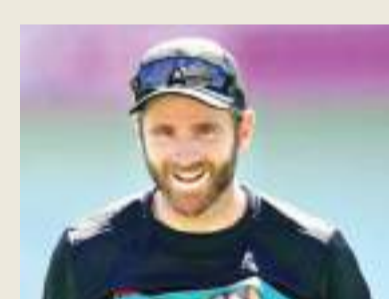
பட்டது கௌரவமாகும்" என்று வில்லியம்ஸன் கூறினார். "மைதானத்திலும் மைதானத்திற்கு வெளியிலும் தலைமைப் பதவி பணிச்சுமையை அதிகரித்திருப்பதோடு இந்தத் தருணத்தில் நான் எடுத்திருக்கும் முடிவு சரியானது என்று கருதுகிறேன்" என வில்லியம்ஸன் தனது விலகல் குறித்து தெரிவித்துள்ளார்.

நியூசிலாந்து டெஸ்ட் அணியின் தலைமை பொறுப்பில் இருந்து கேள் வில்லியம்ஸன் விலகியுள்ளார். அவருக்கு பதில் டிம் செனதி புதிய தலைவராக நியமிக்கப்பட்டுள்ளார். 32 வயதான வில்லியம்ஸன் ஒருநாள் மற்றும் டி20 சர்வதேச போட்டிகளில் தொடர்ந்து தலைவராக செயற்பட்டவுள்ளார். தற்போது இங்கிலாந்து பயிற்சியாளராக இருக்கும் பிரன்டன் மக் கலமுக்கு பதில் 2016 ஆம் ஆண்டு வில்லியம்ஸன் டெஸ்ட் தலைவராக நியமிக்கப்பட்டார். 40 போட்டிகளில் தலைவராக செயற்பட்டிருக்கும் அவர் 22 போட்டிகளில் வெற்றியீட்டியுள்ளார். "டெஸ்ட் கிரிக்கெட்"ில் நியூசிலாந்து அணிக்கே தலைவராக செயற்பட்டது கௌரவமாகும்" என்று வில்லியம்ஸன் கூறினார். "மைதானத்திலும் மைதானத்திற்கு வெளியிலும் தலைமைப் பதவி பணிச்சுமையை அதிகரித்திருப்பதோடு இந்தத் தருணத்தில் நான் எடுத்திருக்கும் முடிவு சரியானது என்று கருதுகிறேன்" என வில்லியம்ஸன் தனது விலகல் குறித்து தெரிவித்துள்ளார்.