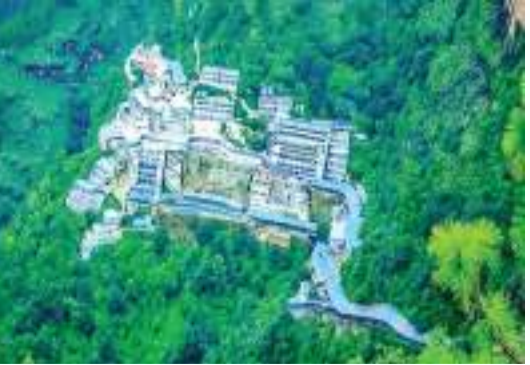
இறுதியில் இந்த எண்ணிக்கை ஒரு கோடியை தாண்டும் என்று எதிர்பார்க்கப்படுகிறது.

கொவிட் பெருந்தொற்று காரணமாக இரண்டு ஆண்டுகள் மூடப்பட்டிருந்த ஜம்மு மாகாணத்தில் உள்ள மாதாவைஷ்னோ தேவி ஆலயம் இந்த ஆண்டு ஒரு கோடிக்கும் அதிகமான யாத்திரிகர்களை வரவேற்கவுள்ளது. இந்த ஆண்டில் இதுவரை இந்த ஆலயத்துக்கு 86 இலட்சம் யாத்திரிகர்கள் வருகை தந்திருக்கும் நிலையில் இந்த மாத