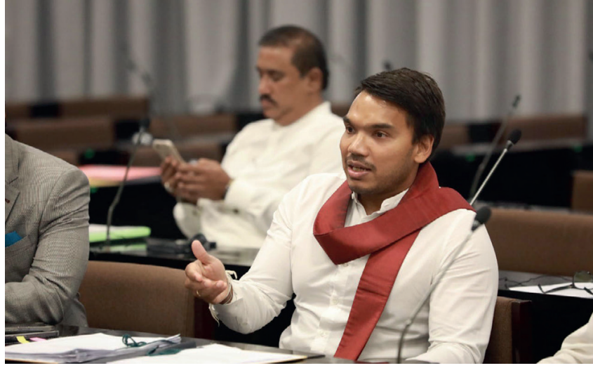
மட்டுமே நடந்துள்ளது. இலங்கை மின்சார சபையை பாதுகாக்க வேண்டுமென்கிற நிலைப்பாட்டில் பலர் இருக்கிறார்கள். அவ்வாறு பாதுகாப்பதாக இருந்தால் மின்சாரக் கட்டணத்தை அதிகரிக்க வேண்டும் என்பதே எமது நிலைப்பாடு எனவும் தெரிவித்தார். மின்சாரக் கட்டணம் அதிகரிக்குமா இருந்தால் குறைந்த வருமானங்களைப் பெறும் குடும்பங்கள், மத வணக்கஸ்தலங்கள் ஆகியவற்றுக்கு நிவாரணங்களை வழங்க வேண்டும் எனவும் நாமல் கேட்டுக்கொண்டார்.

13ஆவது திருத்தச் சட்டம், தேர்தல்கள் தொடர்பில் அவர்களுக்கு அக்கறை இருந்தால் கடந்த 2, 3 வருடங்களுக்கு முன்பு அவர்கள் தேர்தலைக் காலந்தாழ்த்தியிருக்க மாட்டார்கள். நாட்டைப் பொருளாதார நெருக்கடியிலிருந்து மீட்பதற்கே அதிக முக்கியத்துவம் வழங்கப்பட வேண்டும். அது தொடர்பான நீண்ட கலந்துரையாடல்களை நடத்தி தீர்மானங்கள் எடுக்கப்பட வேண்டும் எனவும் தெரிவித்தார். மின்சாரக் கட்டணம் அதிகரித்துள்ளது என்பதே எமது நிலைப்பாடு. மின்சாரக் கட்டணத்தைக் குறைத்தார் என்பதற்காக முன்னாள் ஜனாதிபதி கோட்டாபய ராஜபக்ஷவுக்கு எதுவும் கிடைக்கவில்லை. மின்சாரம், எரிபொருள், எரிவாயு என்பவற்றை குறைந்த விலைக்கு வழங்கினார். ஆனால் இறுதியில் போராட்டம் நடத்தி அவரை விரட்டியடித்தது