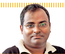
தெ. ஞானசந்தி யிநிலங்கோ

ஜேர்மனியில் அரசாங்கத்துக்கு எதிரான சதியில் ஈடுபட்டதற்காக, வலதுசாரி