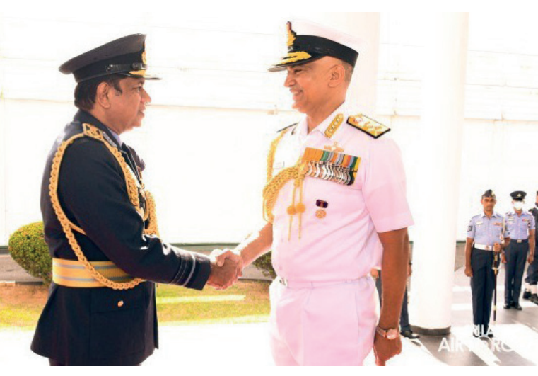
இறுதியாக இந்த நிகழ்வை நினைவு கூறும் வகையில் இருவருக்கும் இடையிலான நினைவுச் சின்னங்களும் பரிமாறப்பட்டன. மேலும் இந்த சந்திப்பில் இலங்கை விமானப்படையின் பணிப்பாளர்களும் கலந்து கொண்டனர்.

இலங்கைக்கு விஜயம் மேற்கொண்டுள்ள இந்திய கடற்படைத் தளபதி அட்டமிரல் ஹரி குமார் மற்றும் இலங்கை விமானப்படைத் தளபதி எயார் மார்க்ஷல் சுதர்சன பத்திரன் ஆகியோருக்கு இடையிலான உத்தியோகபூர்வ சந்திப்பு நேற்று முன்தினம் (14) விமானப்படைத் தலைமையகத்தில் இடம்பெற்றது. இதன்போது, இந்திய கடற்படை தளபதிக்கு இலங்கை விமானப்படையினரின் வர்ண அணிவகுப்பு படை பிரிவினரால் அணிவகுப்பு மரியாதை வழங்கி வரவேற்கப்பட்டது. மேலும் இரு நாடுகளுக்கும் இடையிலான இராணுவப் பயிற்சி மற்றும் பிராந்திய கடல்சார் பாதுகாப்பு தொடர்பாக கிநேசுபூர்வ கலந்துரையாடலும் நடைபெற்றது.