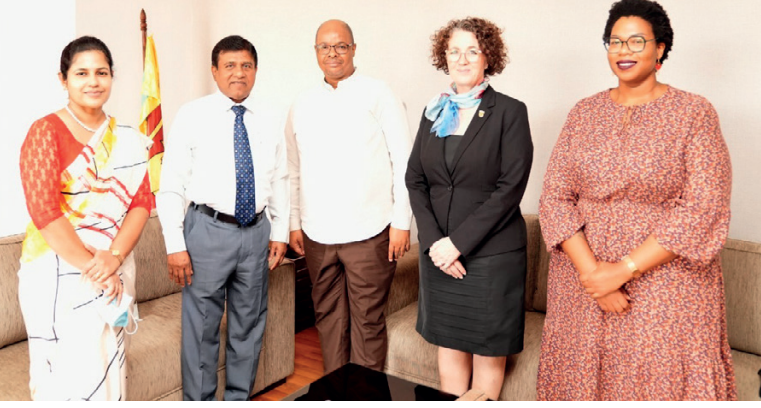
கலந்துரையாடப்பட்டது. இலங்கையின் அடிப்படை உரிமைகள் மற்றும் மனித உரிமைகளை நாட்டில் பாதுகாப்பதை மேலும் வலுப்படுத்த ஆணைக்குழுவைப் பலப்படுத்துவதற்கும், இந்நாட்டின் சட்ட அமைப்பைச் சீர்திருத்துவதற்கும் தேவையான ஆதரவை வழங்குவதற்கு நடவடிக்கை எடுத்து வருவதாக உயர்ஸ்தானிகர் குறிப்பிட்டுள்ளார்.