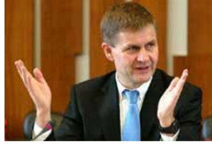
வளங்கள் முன்னேற்றத்திற்காக புதிய முதலீடுகளை அறிமுகப்படுத்த எதிர்பார்த்துள்ளேன்.

இலங்கைக்கு காற்றாலை மற்றும் புதுப்பிக்கத்தக்க சக்தி