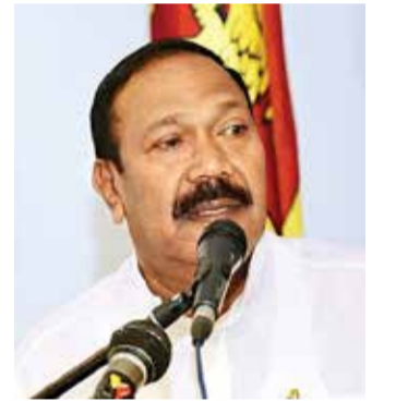
தீவு. காத்திரமான நடவடிக்கைகளை எடுத்தால் இதற்கு முடிவு கட்டலாம்.

அப்படியானால் நாட்டுக்குள் போதைப்பொருள் வருவது எப்படி? இலங்கையானது ஒரு