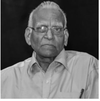
நேற்று கிளிநொச்சியில் நடைபெற்ற இலங்கைத் தமிழ்