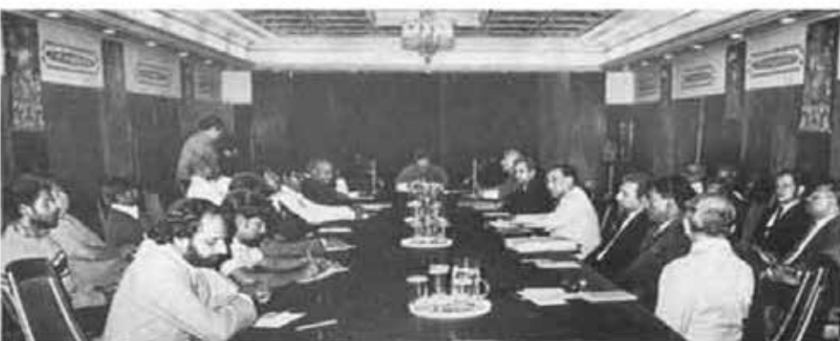
Phase I at Thimpu: The two delegations, the Sri Lanka government's and the Tamil, across the table.

திம்பு பேச்சுவார்த்தை The failed Thimphu talks