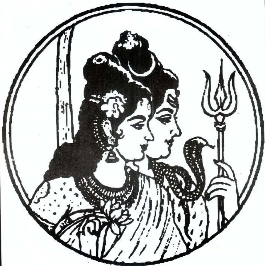
மகாசிவராத்திரி மடபரிபாலனசபை, திருக்கேதீஸ்வரம்.