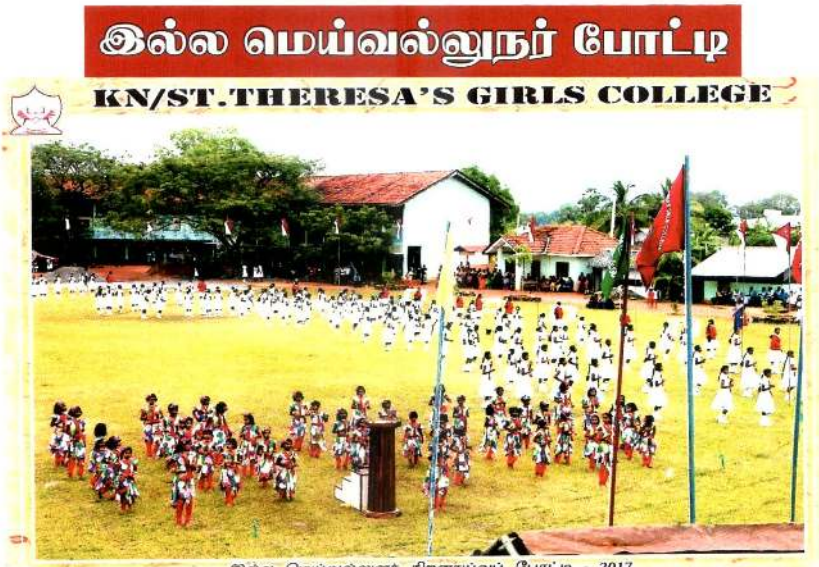
இல்ல மெய்வல்லுனர் திறனாய்வுப் போட்டி - 2017