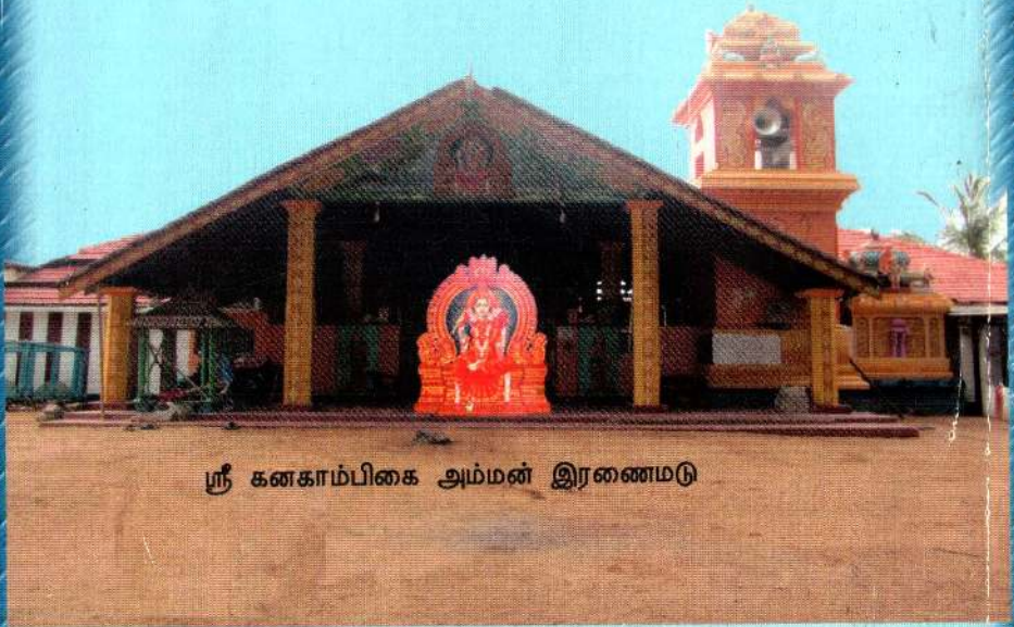
ஸ்ரீ கனகாம்பிகை அம்மன் இரணைமடு

அன்பு காட்டு ஆனால் அடிமையாகி விடாதே இரக்கம் காட்டு ஆனால் ஏமாந்து விடாதே. பணிவாய் இரு ஆனால் கோளையாகாதே. கண்டிப்பாய் இரு ஆனால் கோபப்படாதே. சிக்கனமாய் இரு ஆனால் கஞ்சனாய் இராதே. சுறுசுறுப்பாய் இரு ஆனால் பதட்டப்படாதே. வீரனாய் இரு ஆனால் போக்கிரியாய் இராதே. தர்மம் செய் ஆனால் ஆண்டியாகி விடாதே. பெருளைத் தேடு ஆனால் பேராசைப்படாதே. உழைப்பை நம்பு ஆனால் கடவுளை மறந்து விடாதே. - முதுமொழிகள்