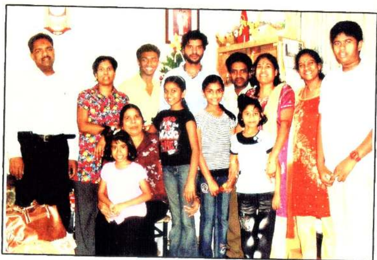
01-01-2012 குடும்பத்துடன் குதாகலிகமாக களித்த நாட்கள்