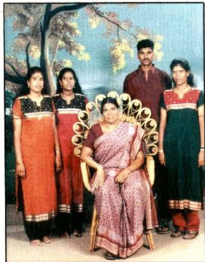
2004ல் அம்மாவுடன் பிள்ளைகள்