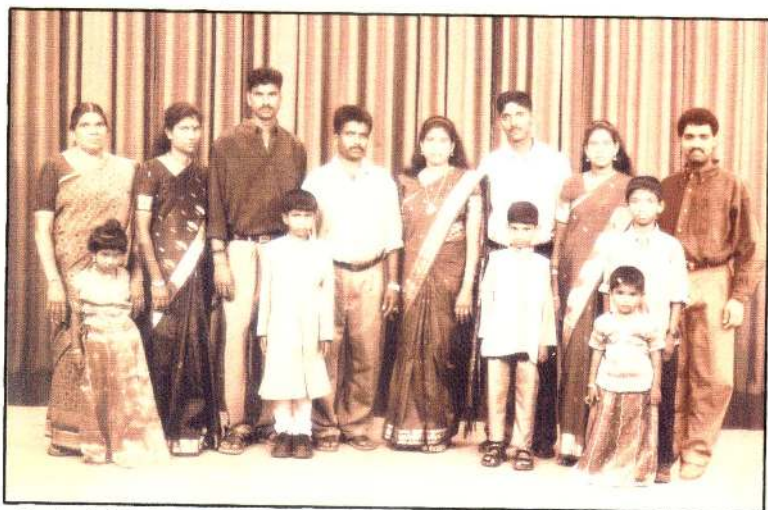
செப் 2004ல் இலங்கையில் குடும்பத்துடன் எடுக்கப்பட்ட படம்