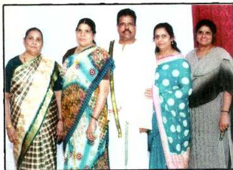
2009ல் சகோதரங்களுடன் எடுக்கப்பட்டது.