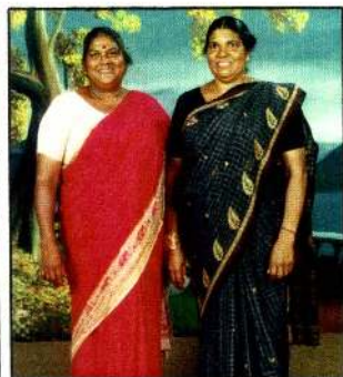
2005ல் சகோதரியுடன் இலங்கையில்