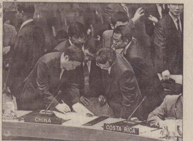
ஆஸ்திரியா, மெக்சிக்கோ, கொஸ்டா - ரிக்கா உட்பட பாதுகாப்புச் சபையின் நிரந்தர உறுப்பினர்கள் அல்லாத பல நாடுகள் இலங்கை (14 ஆம் பக்கம் பார்க்க)

சீனா அதற்கு எதிர்ப்புத் தெரிவித்திருப்பதால் அந்த வாய்ப்பு அனேகமாக அடிபட்டுப் போய்விட்டதாக நேற்றிரவு கிடைத்த பிந்திய தகவல்கள் தெரிவித்தன.