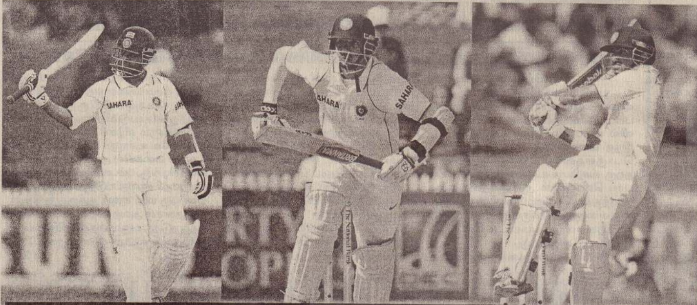
அபாரமாக ஆடி அரைச் சதம் கடந்த இந்திய அணி வீரர்கள் சச்சின், டிராவிட், கம்பீர்...

மேற்கிந்திய மைதானத்தில் போட்டிகளை நடத்த ஓராண்டுத் தடை