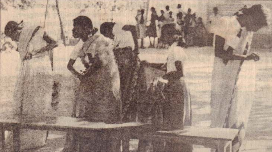
அளவெட்டி சதானந்தா வித்தியாலயத்தின் இல்ல மெய்வன்மைப் போட்டியில் சாறி உடுக்கும் போட்டியில் மாணவிகள் பங்குபற்றியிருப்பதை படத்தில் காணலாம்.