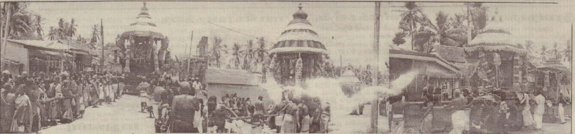
வண்ணார் பண்ணை ஸ்ரீ மத் வாலாம்பிகை சமேத வைத்தீஸ் வரன் ஆலயத் தேர்த் திருவிழா நேற்று பத்தி பூர்வமாக நடைபெற்றது. ஆயிரக்கணக்கான அடியார்கள் சிவன் மற்றும் மூர்த்திகளின் தேர்வீதி உலாவைத் தரி சிக்கத் திரண்டனர். நேற்றைய தேர்த்திருவிழாவின் போது பஞ்ச ரதங்களிலும் மூர்த்திகள் வலம் வருவதைப் படங் களில் காணலாம்.