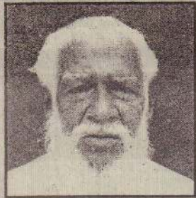
நுணாவில் மத்தி, சாவகச்சேரி.