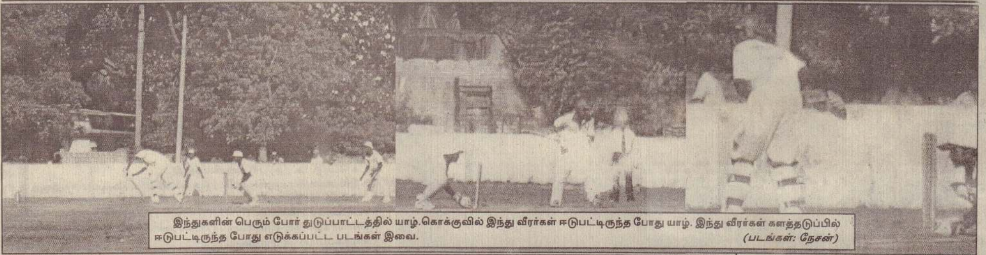
இந்துகளின் பெரும் போர் துடுப்பாட்டத்தில் யாழ்.கொக்குவில் இந்து வீரர்கள் ஈடுபட்டிருந்த போது யாழ். இந்து வீரர்கள் களத்தடுப்பில் ஈடுபட்டிருந்த போது எடுக்கப்பட்ட படங்கள் இவை.