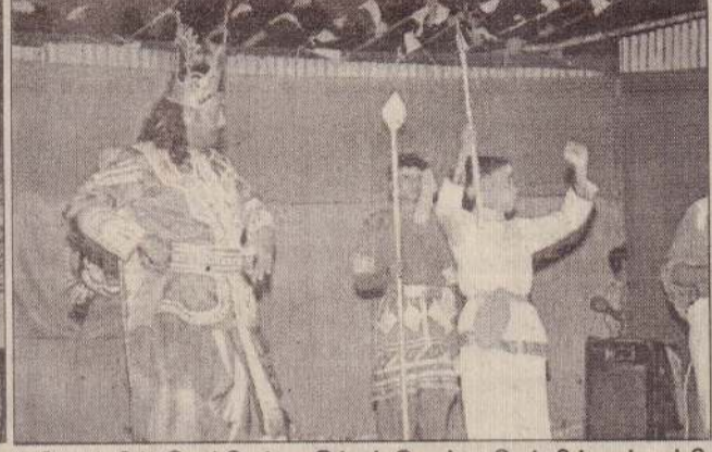
புத்தாண்டை முன்னிட்டு விடுதலைப் புலிகளின் படையணிகளுக்கு இடையே போட்டிகள் நடத்தப்பட்டன. பிரத்தியேகத் தளமொன்றில் இடம்பெற்ற இந்தப் போட்டி நிகழ்வில் துப்பாக்கி சுடும் போட்டிகள் இடம்பெறுவதையும் போட்டி இலக்கில் ஒன்றை வடபோர்முனைக் கட்டளைத் தளபதி கேணல் தீபன் மற்றும் தளபதிகள் மதிப்பிடுவதையும் போட்டியில் வெற்றிபெற்ற போராளி ஒருவருக்கு பரிசு வழங்கப்படுவதையும் பரிசளிப்பு நிகழ்வையடுத்து இடம்பெற்ற அரங்க நிகழ்வையும் படங்களில் காணலாம்.