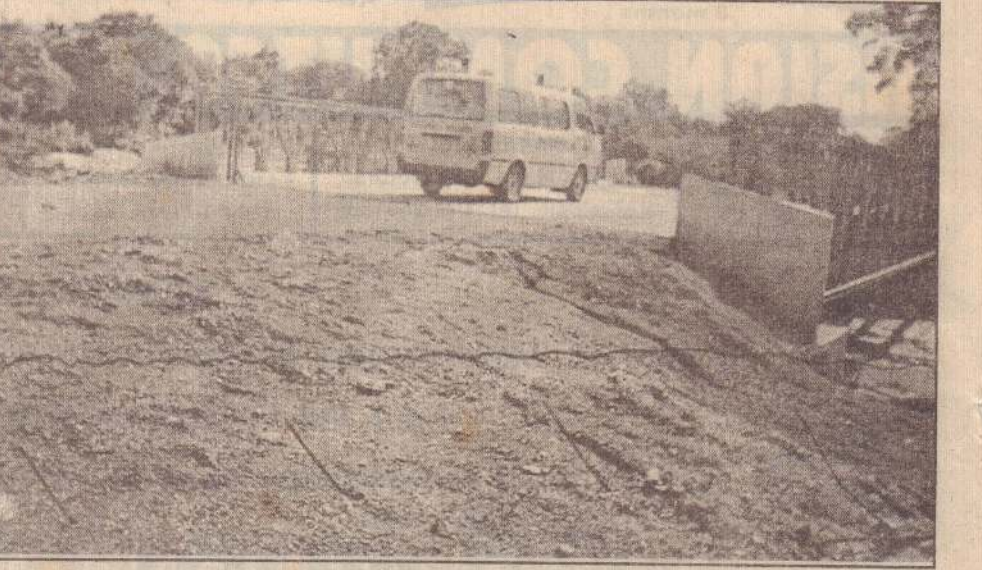
புனியங்குளம் முல்லைத்தீவு வீதியில் சன்னாசி பரந்தன் என்ற இடத்தில் உள்ள பாலம் நீண்ட காலத்துக்குப் பிறகு வீதி அபிவிருத்தி அதிகார சபையால் புனரமைக்கப்பட்டது. அந்தப் பாலத்தைப் படத்தில் காணலாம்.

ருப்புப் பகுதிகளில் கொட்டப்படுகின்றன. இதனால், அவ்விடங்களில் மழைநீர் தேங்கி நின்று தூர்நாற்றம் வீசுகின்றது. அங்கு ஏற்பட்டுள்ள சூழல் மாசடைவால் இப்பகுதிகளில் நுளம்புகளின் பெருக்கம் அதிகரித்துள்ளதால் மலேரியா, டைபாய்டு மற்றும் நோய்களின் தாக்கம் ஏற்படும் அபாயம் உள்ளதாகவும் தெரிவிக்கப்பட்டது. (த-6-341)