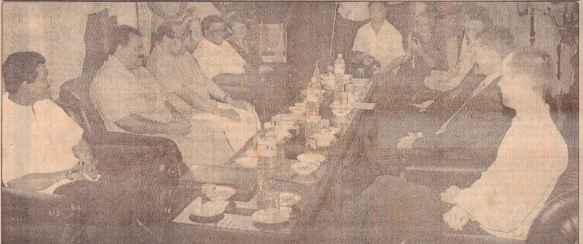
கிளிநொச்சியில் நேற்று இடம்பெற்ற சந்திப்பின்போது.....